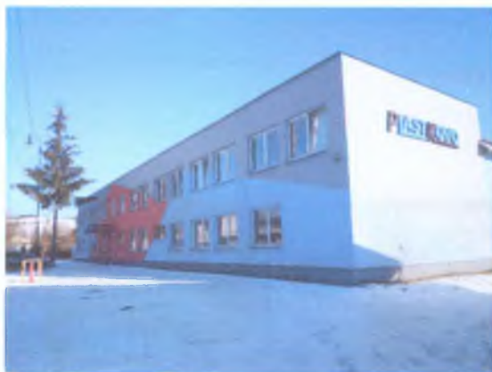
Výrobná hala KOVOLISOVNĀ