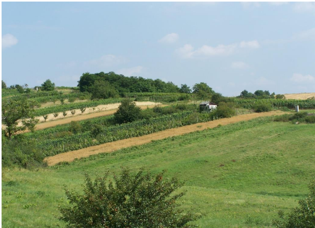
Pohľad na vinohrady súkromných vlastníkov

V obci sa v r. 2023 poskytovali tieto služby: