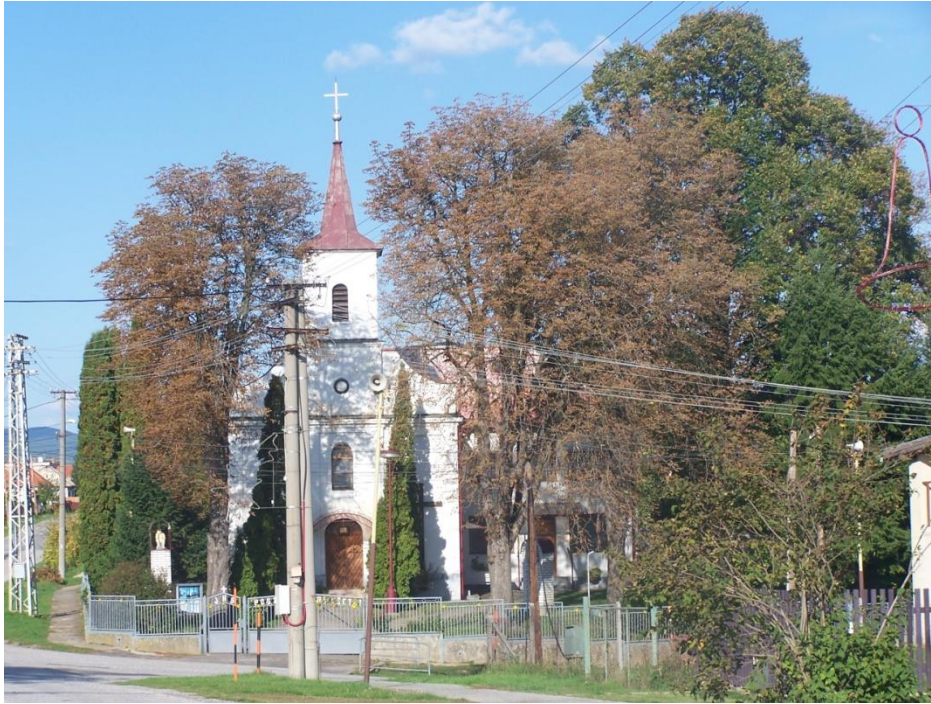
Kostol sv. Juraja v obci