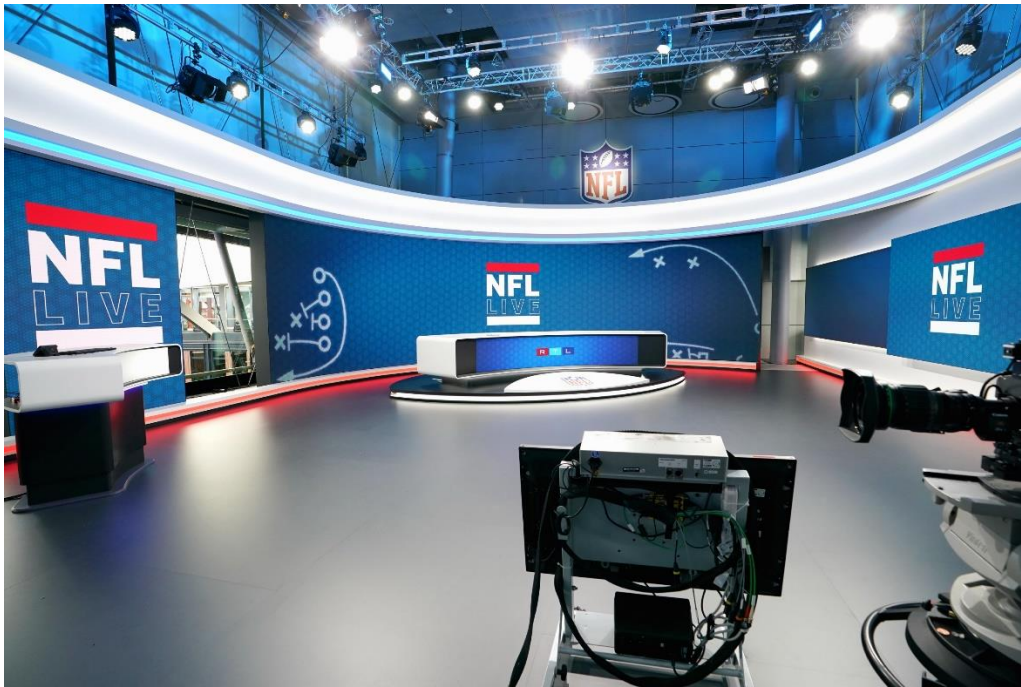
RTL Deutschland NFL broadcast studio, Cologne, Germany Produkty: AT 1.5, TVF 1.2, LPO 7.8, CLI 1.3 Flex Výmera obrazovky: 72.25 m 2