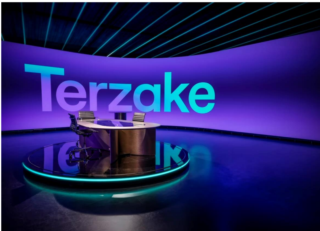
VRT Multifunctional Studio, Brussels, Belgium Produkty: VEM 1.8 Výmera obrazovky: 127.53 m 2