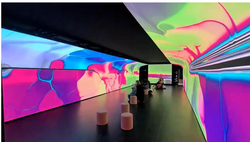
Art Explora – A unique museum-boat, Nice, France Produkty: CL 1.5, CLI 1.5 Flex, LU 1.9 Výmera obrazoviek: 123.5 m 2