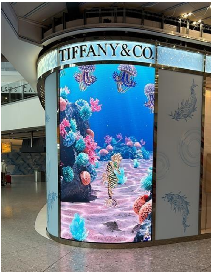
Tiffany & Co, Heathrow Airport, UK Produkty: CL 2.6 Flex Výmera obrazoviek: 18.56 m 2

Počas roku 2023 spoločnosť realizovala projekty v zahraničí zamerané na rôzne vertikálne trhy.