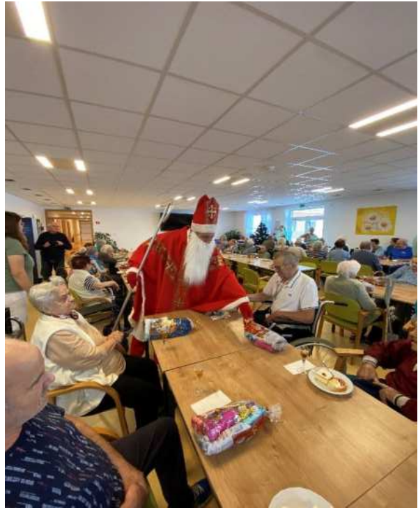
Štedrý deň v Terézia, n. o.