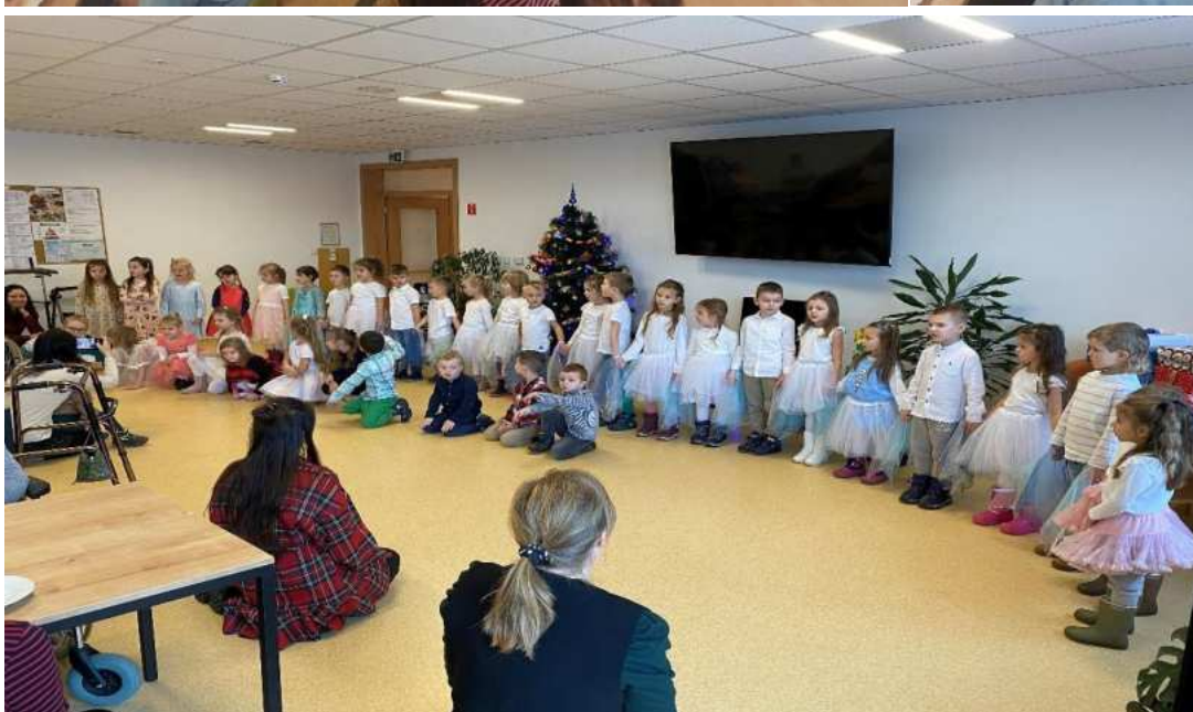
Vystúpenie folklórneho súboru z Oravskej Jasenice