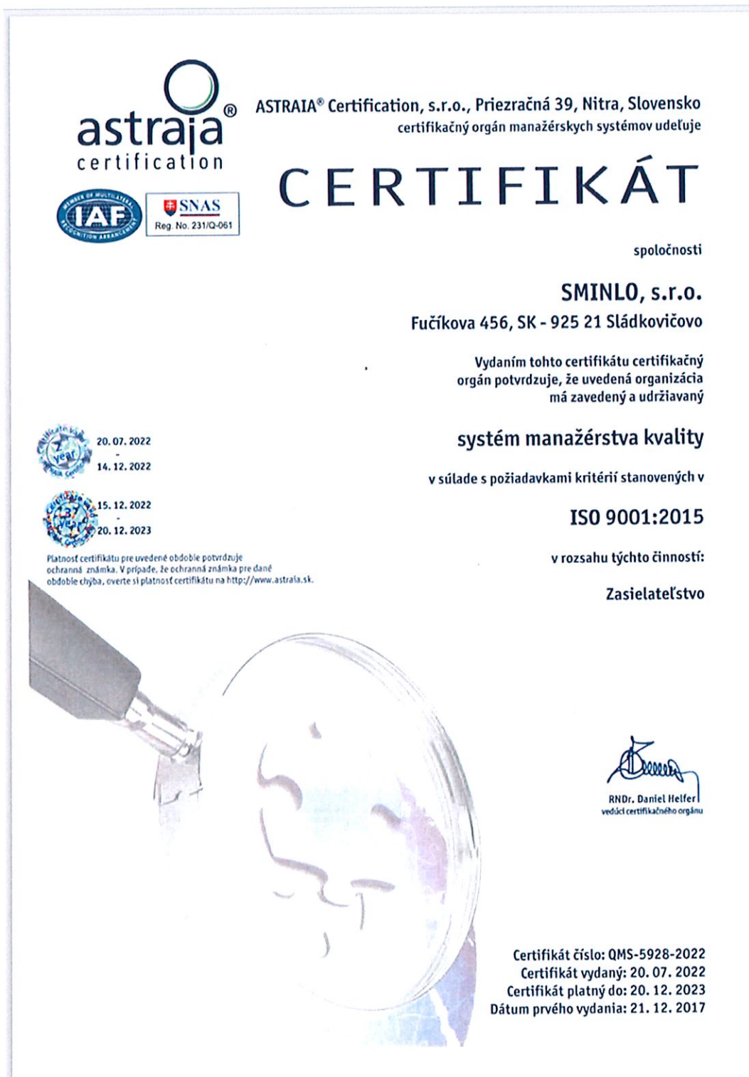
Obrázok 1: Certifikát riadenia kvality ISO 9001:2015