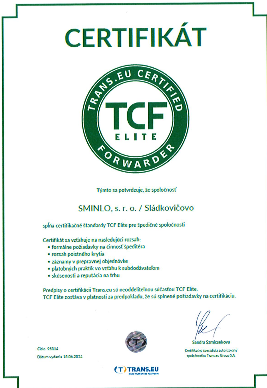
Obrázok 5: Certifikát TCF Elite pre špedičné spoločnosti