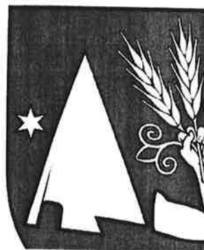
Obr. č.5 Vlajka, pečať, erb

Heraldická komisia Ministerstva vnútra Slovenskej republiky prerokovala návrh erbu obce Podlužany a odporučila ho na prijatie obecným zastupiteľstvom a na zaevidovanie do Heraldického registra SR v tejto podobe: