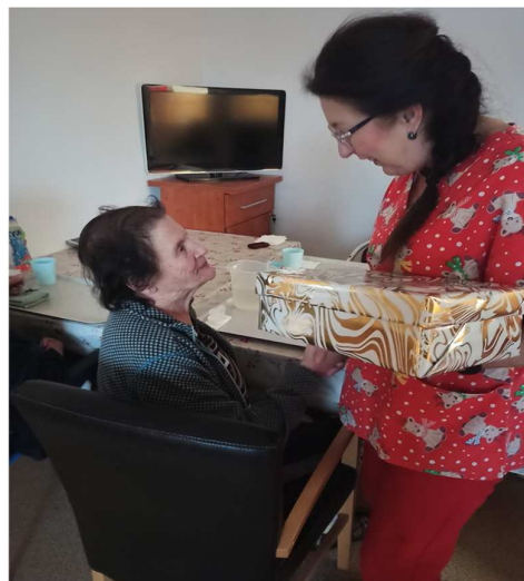
Koľko lásky sa zmestí do krabice od topánok 2023