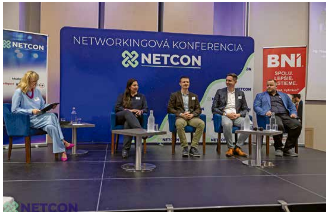
Netcon je najväčšia slovenská networkingová konferencia pre podnikateľov.

„V malom a strednom podnikaní jeden človek či menšia skupina manažérov zastupuje viacero rolí. Vo veľkom biznise však treba