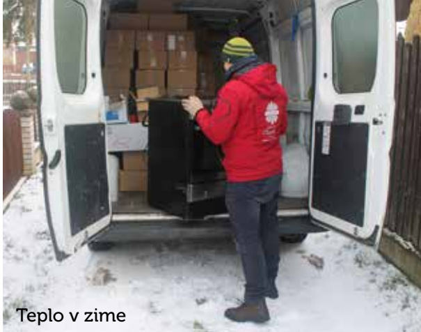
Tepló v zime