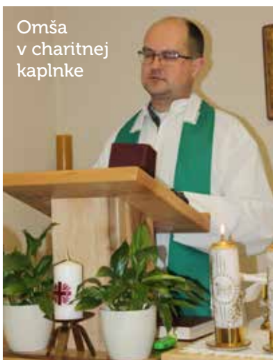
Omša v charitnej kaplnke