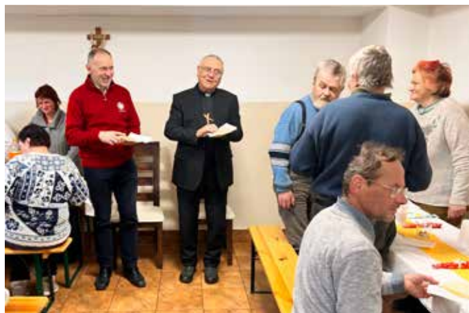
▲ S úsmevom to ide ľahšie