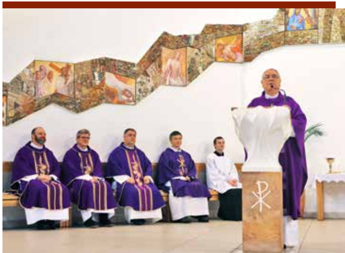
▲ Spoločná omša