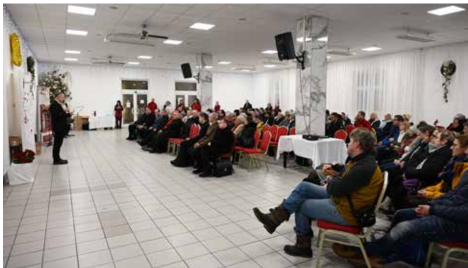
▼ 15. narodeniny