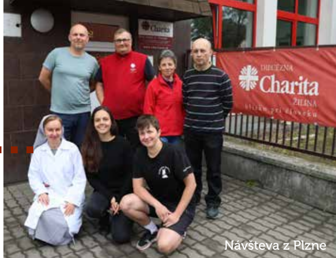
Návšteva z Plzne

Nie všetko, čo sa udialo v roku 2023, sa dá popísať na pár riadkoch, vyberáme niekoľko udalostí v obrazoch.