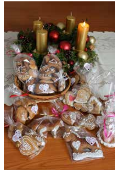
▼ Medovníky pre chudobných