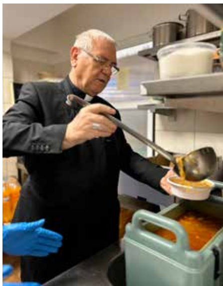
▲ Otec biskup pre chudobných