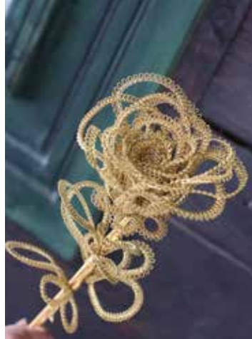
◀ Ruža sv. Alžbety