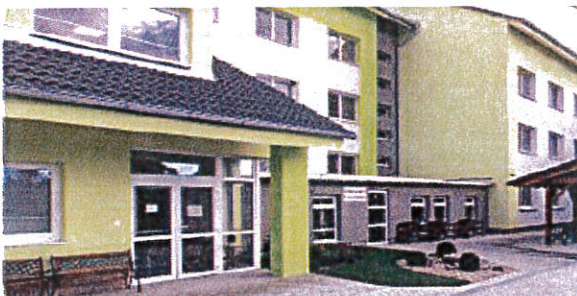
Budova Zariadenia pre seniorov Križovany nad Dudváhom Školstvo

Zákon číslo 416/2001 Z. z. o prechode niektorých pôsobností z orgánov štátnej správy na obce a na vyššie územné celky, ustanovil prenesenie výkonu pôsobnosti štátnej správy na obce a samosprávne kraje a prechod pôsobnosti v rozsahu ustanovenom zákonom z orgánov štátnej správy do samosprávnej pôsobnosti obcí a samosprávnych krajov. Zariadenie pre seniorov má celoslovenskú pôsobnosť, čo znamená, že poskytuje služby nielen obyvateľom vo svojom blízkom okolí, ale aj žiadateľom v rámci celého Slovenska. Zariadenie poskytuje v zmysle zákona č. 448/2008 Z.z. o sociálnych službách v znení neskorších predpisov odbornú sociálnu, zdravotnú a poradenskú starostlivosť hlavne starým a ťažko-chorým občanom, ktorí sa už nedokážu o seba postarať a nie je im možné poskytnúť inú formu starostlivosti, akou je napríklad opatrovateľská služba. V obci sa nachádza zariadenie pre seniorov (pôvodne s názvom domov dôchodcov), s kapacitou 80 lôžok, pričom je plne obsadený. Stravovanie pre klientov zabezpečuje zariadenie pre seniorov vlastnou stravovacou prevádzkou. Pripravujú sa chody jedál ako raňajky, desiata, obed, olovrant a večera. Zdravotná starostlivosť je zabezpečovaná ošetrojúcou obvodnou lekárkou priamo v zariadení. Lekárka pravidelne navštevuje obyvateľov zariadenia, podľa potreby aj na ich izbách. Odborné vyšetrenia klientov sa vykonávajú priamo u odborných lekárov, na základe odporúčenia ošetrojúceho lekára.