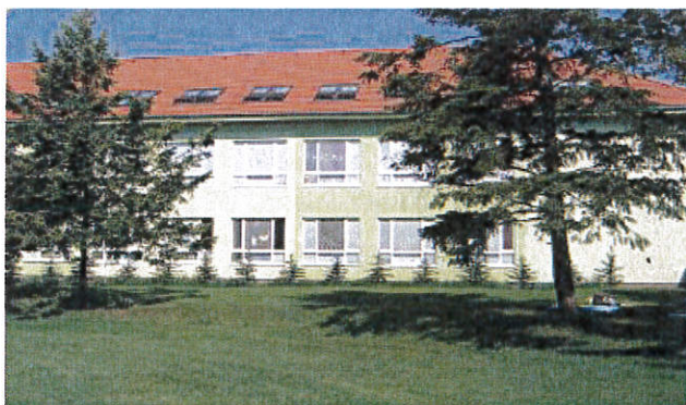
Budova Základnej školy s materskou školou Križovany nad Dudváhom

Materskú školu navštevovalo v školskom roku 2015/2016 41 detí, v školskom roku 2016/2017 37 detí, v školskom roku 2017/2018 54 detí, v školskom roku 2018/2019 56 detí, v školskom roku 2019/2020 59 žiakov, v školskom roku 2020/2021 62 žiakov, v školskom roku 2021/2022 74 žiakov, v školskom roku 2022/2023 77 žiakov a v školskom roku 2023/2024 73 žiakov.