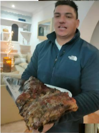
Argentínske a Slovenské Vianoce 2023