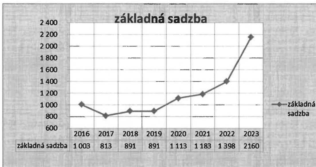
Graf č.2 Základná sadzba pre NsP,n.o. Revúca roky 2016 – 2023

Z grafu č. 2 je vidieť, že základná sadzba určená pre našu nemocnicu v rokoch 2016 – 2019 bola nízka a stagnovala. V rokoch 2020 - 2021 dochádzalo k priebežnému navyšovaniu. Pre rok 2022 a následne 2023 na základe vydaného dokumentu „Základné sadzby“ v ktorom je uverejnený zoznam základných sadzieb platný pre poskytovateľov ústavnej zdravotnej starostlivosti financovaných v zmysle úhradového systému SK-DRG boli pre všetky všeobecné nemocnice typu 1,2 určené rovnaké hodnoty základnej sadzby pre rok 2022 vo výške 2.160 € a pre rok 2023 vo výške 2.830 €.