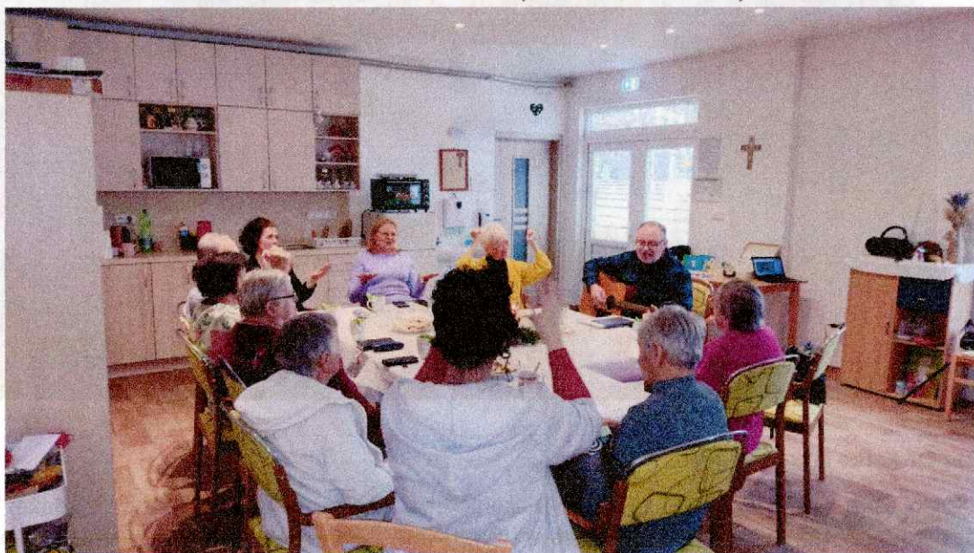
Obr. 2 Biblická hodina za účasti členov CZ ECAV Košice (adventné stretnutie)

Naši klienti sa tiež zúčastnili viacerých kultúrnych podujatí. Vo februári navštívili putovnú výstavu obrazov „Cesta môjho zotavenia“ vo verejnej knižnici. Podujatie pripravila organizácia ODOS a predstavené diela namalovali ľudia žijúci s rôznymi psychiatrickými diagnózami. Klienti v sprievode personálu Diakonického centra sa tiež zúčastnili Dňa otvorených dverí v Botanickej záhrade UPJŠ v Košiciach a Výstavy fosílií a minerálov na Technickej univerzite v Košiciach.