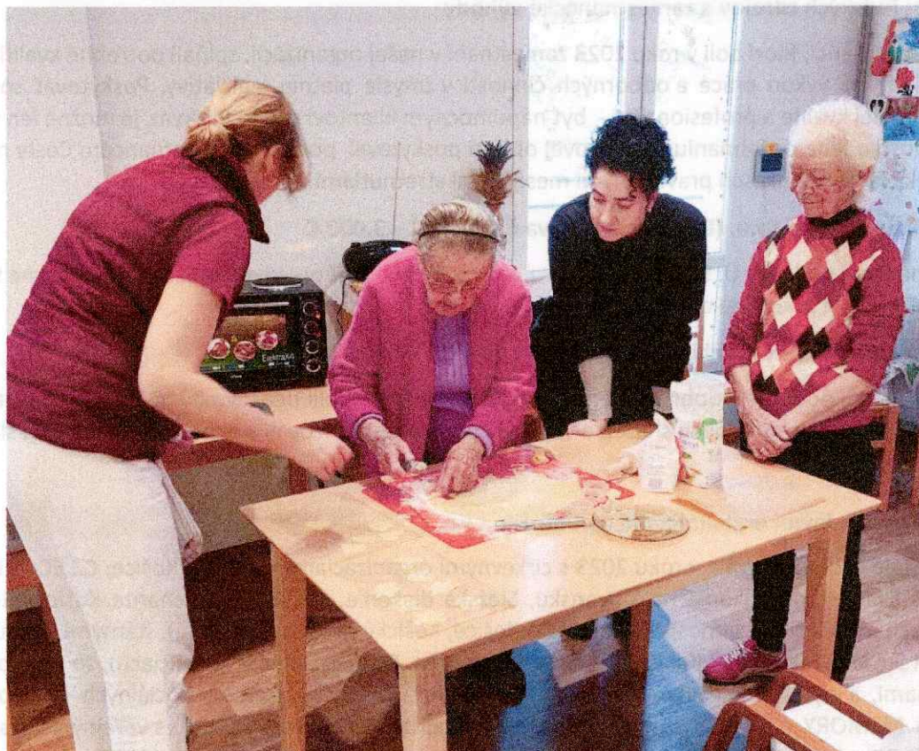
Obr. 5 Prvé vianočné pečenie