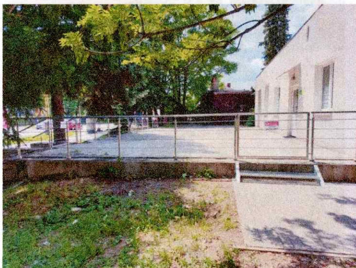
Obr. 6 Rekonštrukcia terasy a prístupový chodník

Tieto úpravy zlepšili dostupnosť a bezpečnosť našich služieb pre ľudí žijúcich s demenciou a ich opatrovateľov.