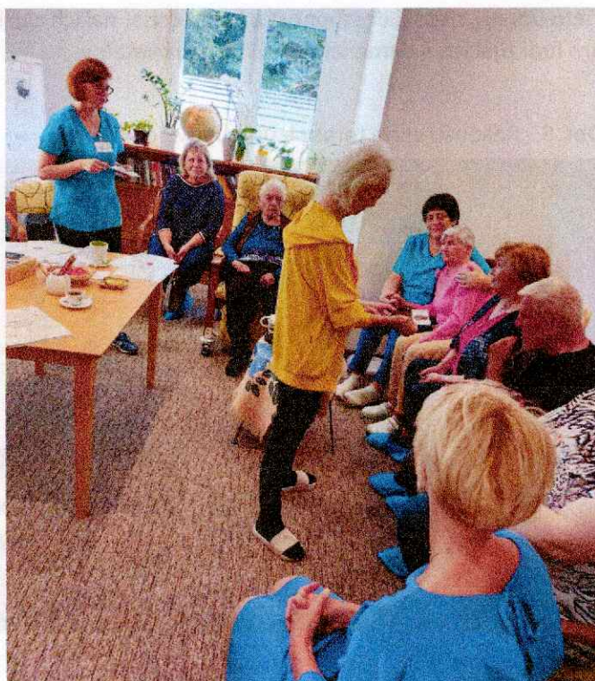
Obr. 7 Deň otvorených dverí

Prostredníctvom krátkej prednášky sa návštevníci mohli dozvedieť o dôležitosti sociálnej opory pre ich celkové zdravie a kvalitu života. Zapojením sa do aktivizácie a kognitívneho tréningu pre seniorov s témou „káva“ si precvičili svoju pamäť a zapojili všetky svoje zmysly (Obr. 7).