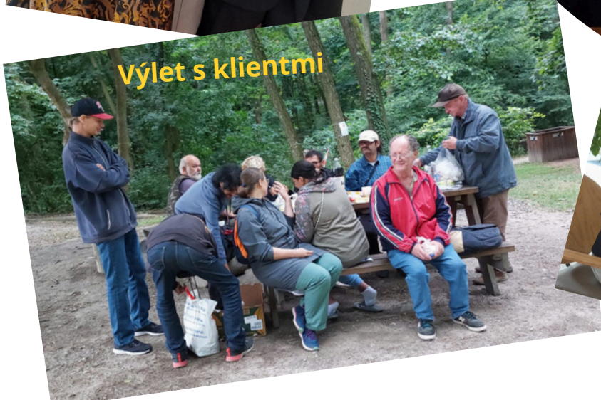
Výlet s klientmi