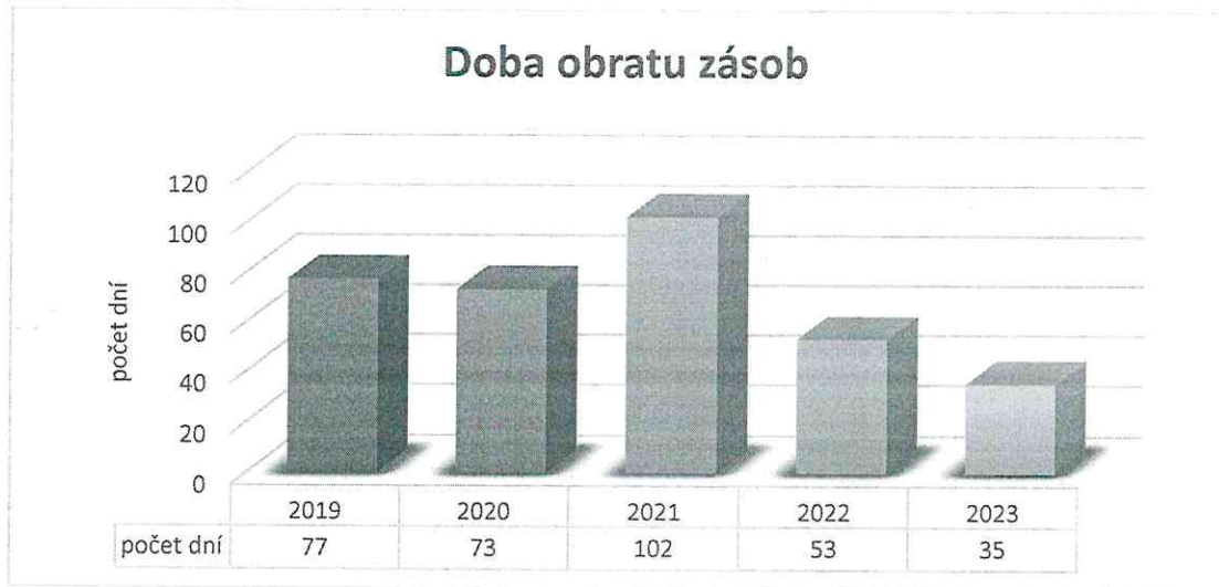
Graf 1. Doba obratu zásob