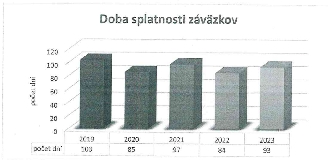
Graf 3. Doba splatnosti závazkov