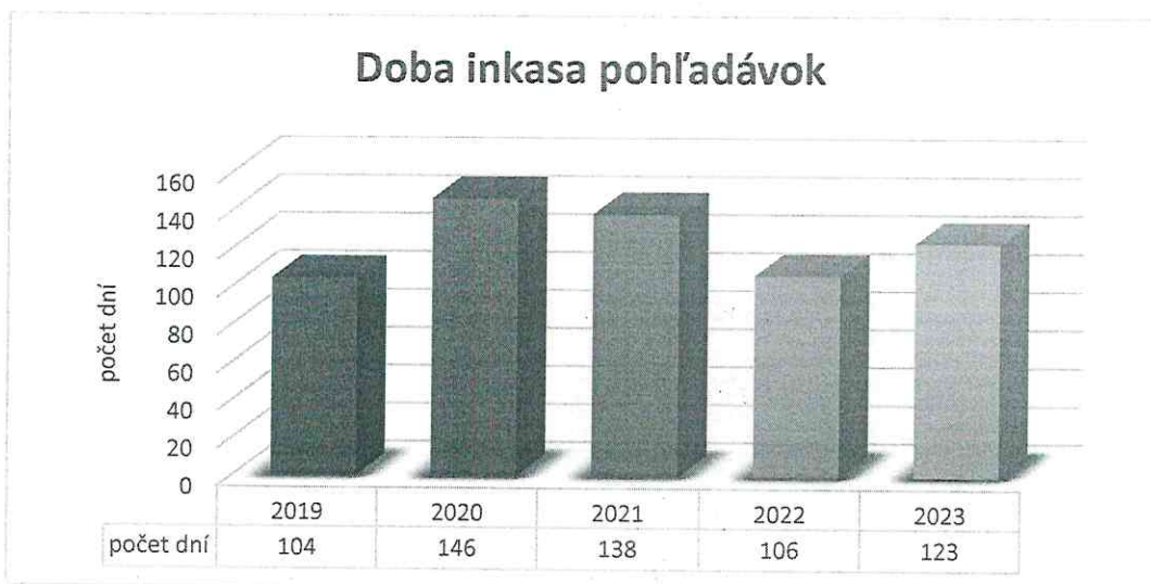
Graf 2. Doba inkasa pohľadávok

Ukazovateľ inkasa pohľadávok a splatnosti záväzkov vyjadruje dobu splatnosti v dňoch. Oba ukazovatele sú porovnaním dĺžky času od vzniku záväzku resp. pohľadávky po ich úhradu, čím umožňuje charakterizovať finančnú situáciu spoločnosti. Doba inkasa pohľadávok z obchodného styku v roku 2021 bola 138 dní, v roku 2022 bola 106 dní a v roku 2023 je 123 dní.