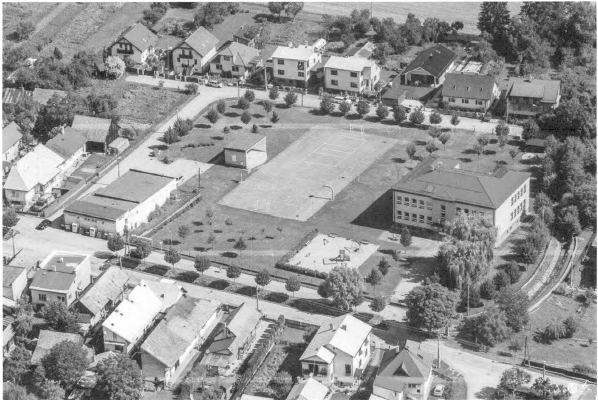
Budova Základnej školy