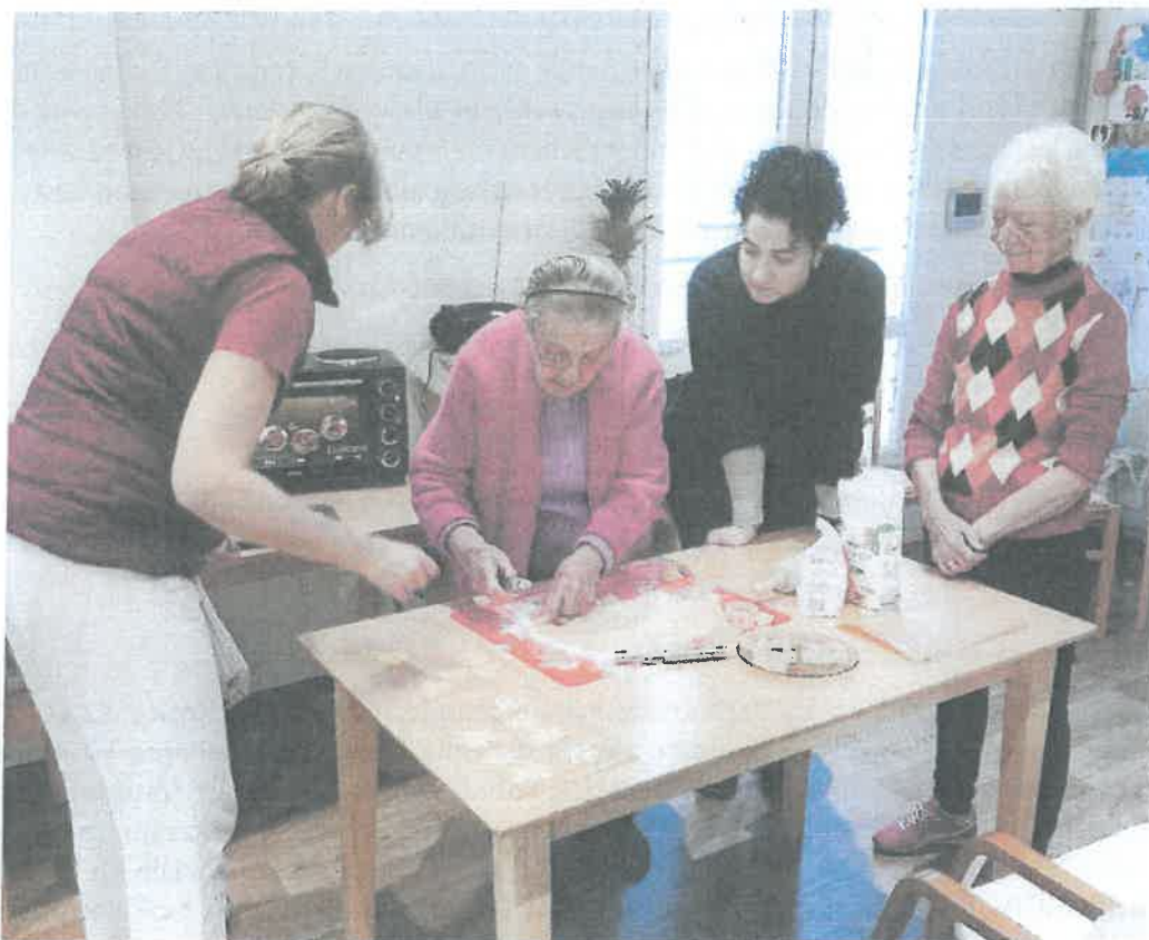
Obr. 5 Prvé vianočné pečenie