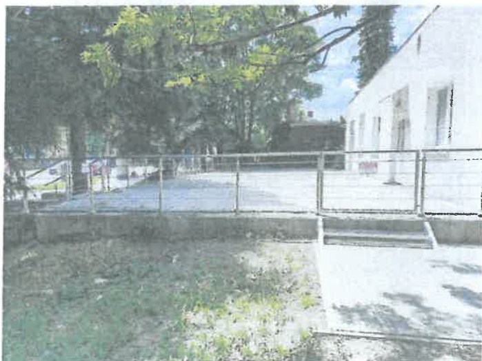
Obr. 6 Rekonštrukcia terasy a prístupový chodník

Tieto úpravy zlepšili dostupnosť a bezpečnosť našich služieb pre ľudí žijúcich s demenciou a ich opatrovateľov.