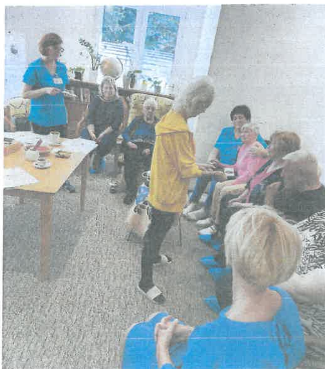
Obr. 7 Deň otvorených dverí

Prostredníctvom krátkej prednášky sa návštevníci mohli dozvedieť o dôležitosti sociálnej opory pre ich celkové zdravie a kvalitu života. Zapojením sa do aktivizácie a kognitívneho tréningu pre seniorov s témou „káva“ si precvičili svoju pamäť a zapojili všetky svoje zmysly (Obr. 7).