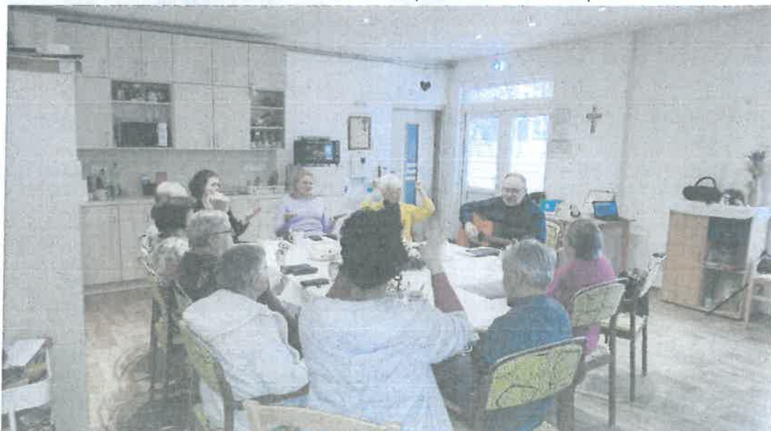
Obr. 2 Biblická hodina za účasti členov CZ ECAV Košice (adventné stretnutie)

Naši klienti sa tiež zúčastnili viacerých kultúrnych podujatí. Vo februári navštívili putovnú výstavu obrazov „Cesta môjho zotavenia“ vo verejnej knižnici. Podujatie pripravila organizácia ODOS a predstavené diela namaľovali ľudia žijúci s rôznymi psychiatrickými diagnózami. Klienti v sprievode personálu Diakonického centra sa tiež zúčastnili Dňa otvorených dverí v Botanickej záhrade UPJŠ v Košiciach a Výstavy fosílií a minerálov na Technickej univerzite v Košiciach.