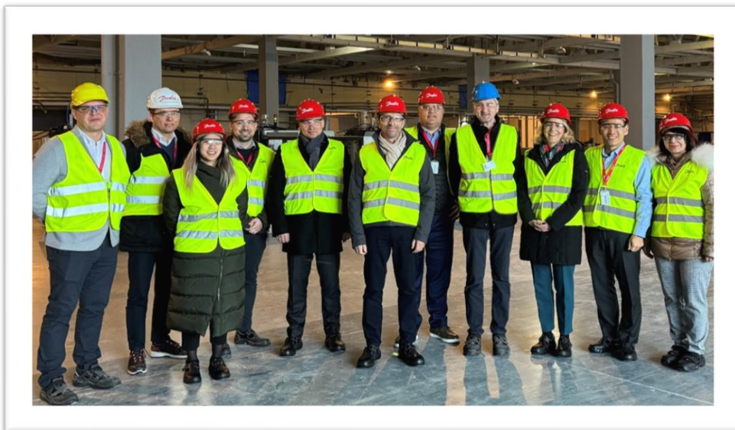
Prehliadka Organizačnej zložky v Dubnici nad Váhom

Zároveň sa bude Spoločnosť ešte viac presadiť svoje predaje na tuzemsko trhu.