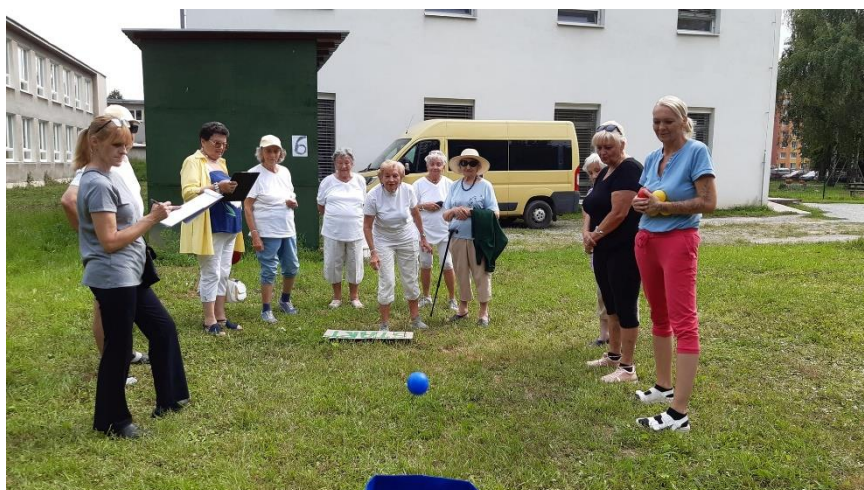
Šport a súťaženie