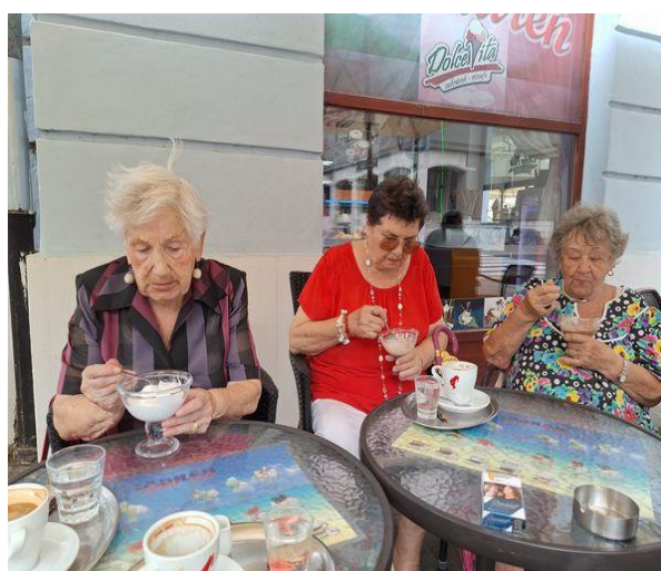
Kávičkujeme v kaviarni