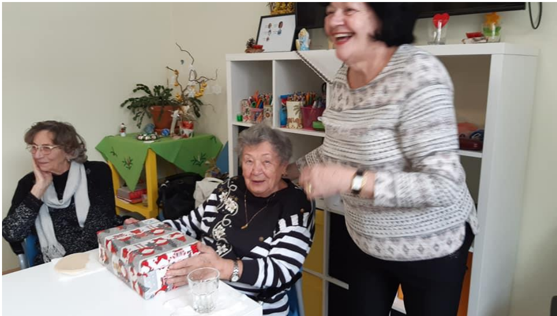
Vianočná kapustnica a rozdanie darčiekov

Záver roka sme si spríjemnili už tradične posedením pri sviatočnom stole, na ktorom nesmeli chýbať tradičné vianočné jedlá a prišiel aj náš pán riaditeľ. Nezabudol na nás ani Mikuláš a ani Ježiško a doniesli nám darčeky. Do nového roka sa pozeráme optimisticky. Popriali sme si hlavne zdravie a šťastie, rodinnú pohodu a Božie požehnanie. Veríme, že sa takto budeme môcť stretávať ešte dlho.