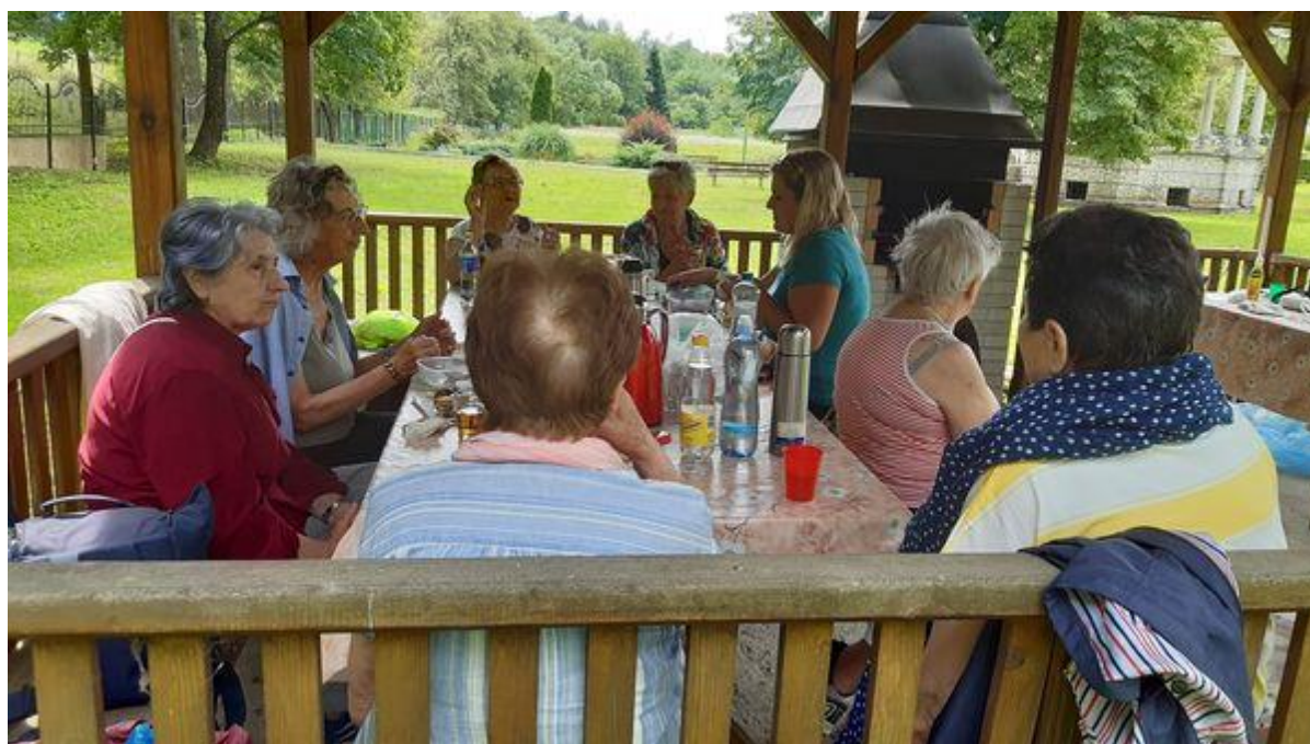
Spoločné prechádzky spojené s grilovaním na Cemjate