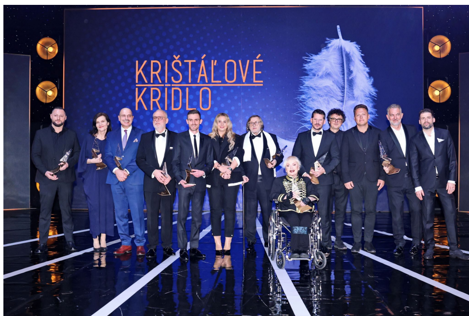
Laureáti 27. ročníka Krištáľového krídla za rok 2023

Nadácia Kooperativa vníma pozitívny dopad podujatia na celoslovenskej úrovni. Naša spoločnosť potrebuje vidieť vzory osobností, ktoré dokážu posunúť našu krajinu ďalej. Veľakrát práve nezlomnosť, ľudskosť, nádej sú ingrediencie slávnostnej udalosti, ktorá dáva pozitívny signál pre ostatných a motivuje rôzne generácie k zmysluplným činom pre rozvoj Slovenska.