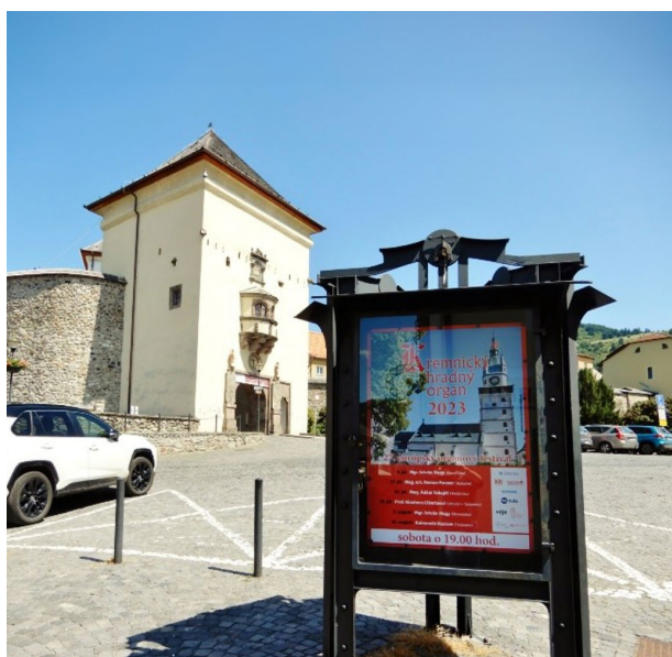
Kremnický hradný organový festival 2023

Uznávaný festival dlhoročne organizuje občianske združenie Asociácia pre európske umenia v kostole sv. Kataríny, v areáli Mestského hradu v Kremnici.