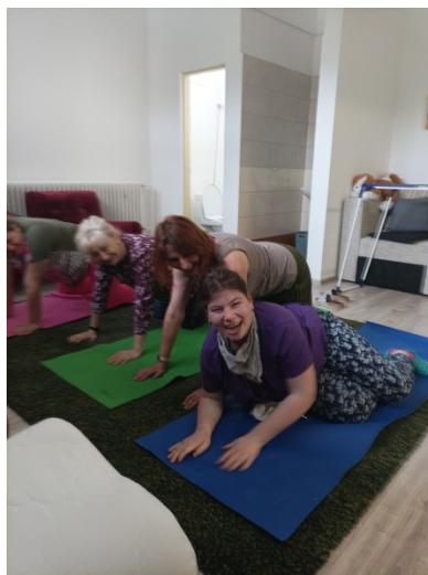
cvičíme a chodíme na prechádzky