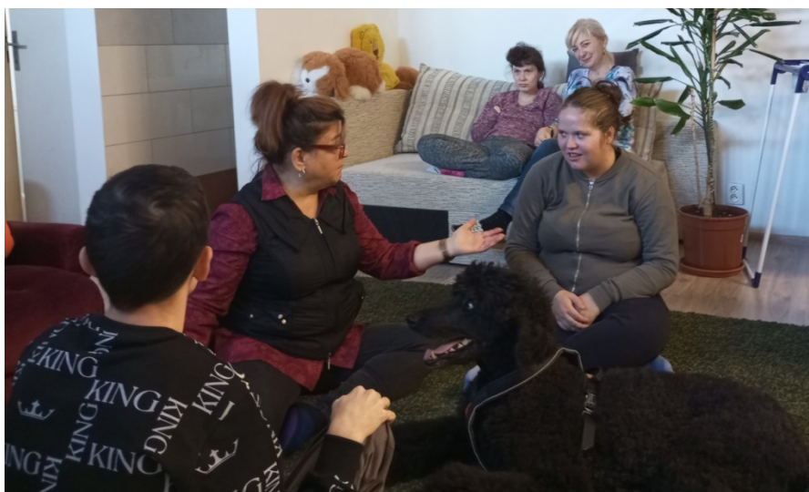
Canisterapia nám pomáha