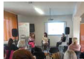
Multidisciplinárne stretnutie a seminár v Dolnom Kubíne