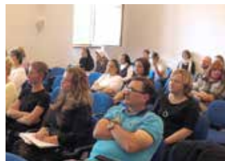
Seminár pre Diecézny katechetický úrad v Banskej Bystrici spolupráci s Centrom Femina.