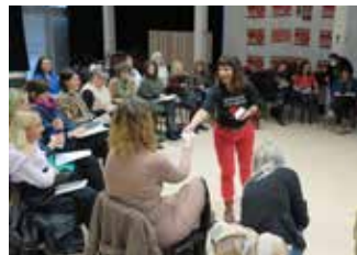
Seminár pre odborníkov v CPP v Prievidzi