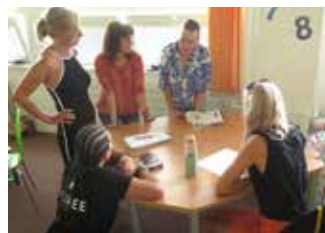
Seminár pre pedagogický tím v súkromnej základnej škole v Senci