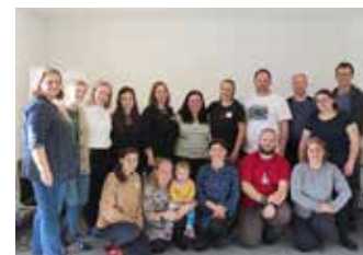
Seminár pre Saleziánov - preventistov