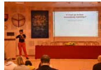
Seminár pre katechéty, Diecézny katechetický úrad Košickej arcidiecézy