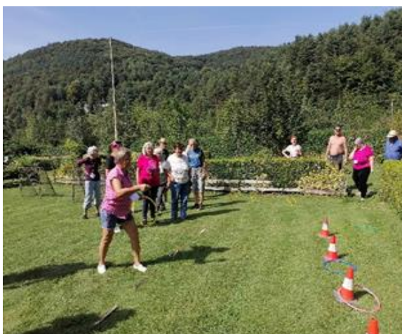
Denný stacionár ANIMUS Šarišské Sokolovce a Lutina „Športový deň 2023“

Posledným poznávacím výletom tohto roku bola návšteva obce Šarišské Michaľany, kde práve prebiehala výstava o histórii tejto obce. Následne prijímatelia navštívili ďalšie historické pamiatky ako grécko-katolícku kaplnku a kaštieľ.