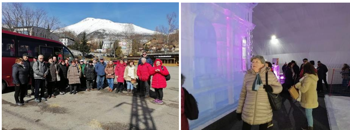
Denný stacionár ANIMUS Šarišské Sokolovce a Lutina „Tatranský ľadový dóm – Vysoké Tatry“

Počas jarných dní prijímatelia navštívili Vysoké Tatry. Hlavným cieľom bola návšteva Tatranského ľadového dómu na Hrebienku. Jubilejný 10. ročník sa umelci inšpirovali sakrálnou Bazilikou Božieho hrobu v Jeruzaleme.