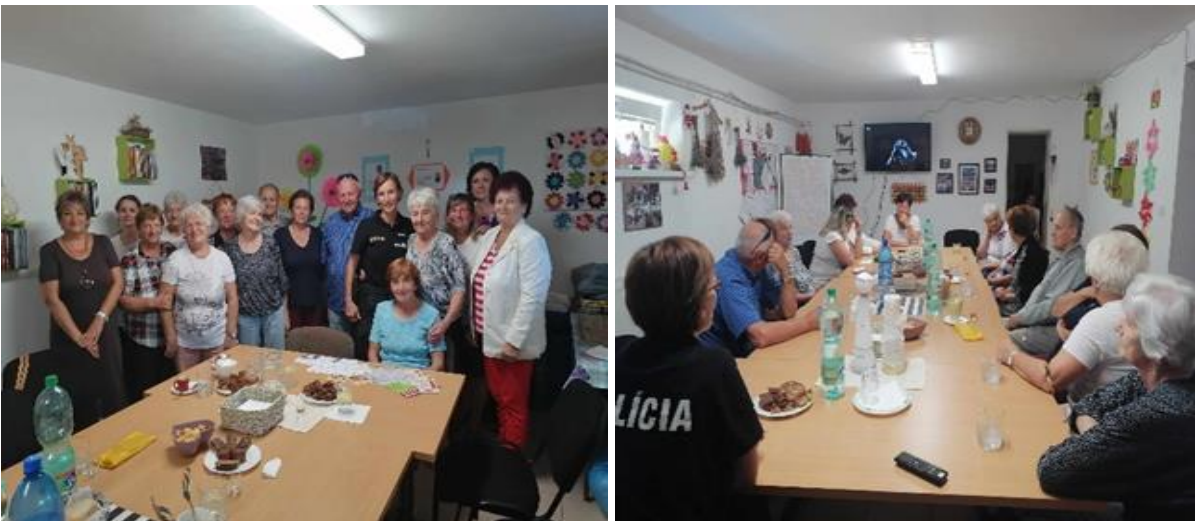
Denný stacionár ANIMUS Šarišské Sokolovce „Odborná prednáška príslušníka PZ – Nástrahy ktoré ohrozujú seniorov“

Snažíme sa v priebehu roka našich prijímateľov edukovať aj v oblastiach, ktoré sú aktuálne pre túto cieľovú skupinu. Po úspešnej prezentácii zdravotníckych tém a praktických cvičení KPR (kardiopulmonálna resuscitácia) sme tento rok pozvali príslušníka Policajného zboru, aby prijímateľom priblížil nástrahy, ktoré najviac ohrozujú seniorov.