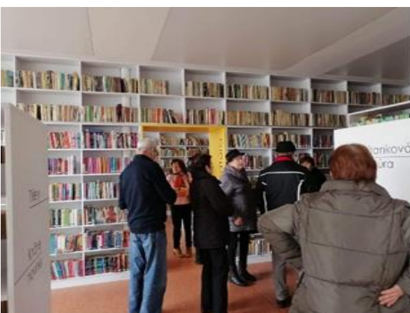
Denný stacionár ANIMUS Šarišské Sokolovce a Lutina „Návšteva mestskej knižnice v Sabinove“

Prešovský samosprávny kraj ponúka množstvo možností ako efektívne tráviť čas a zároveň spoznávať bohatstvo tohto regiónu. Prijímatelia tentokrát navštívili Hvezdáreň a planetárium v Prešove. Návšteva hviezdnej sály poskytla prijímateľom mnoho informácií o astronomických témach, ale bol to rovnako aj silný kultúrny zážitok.