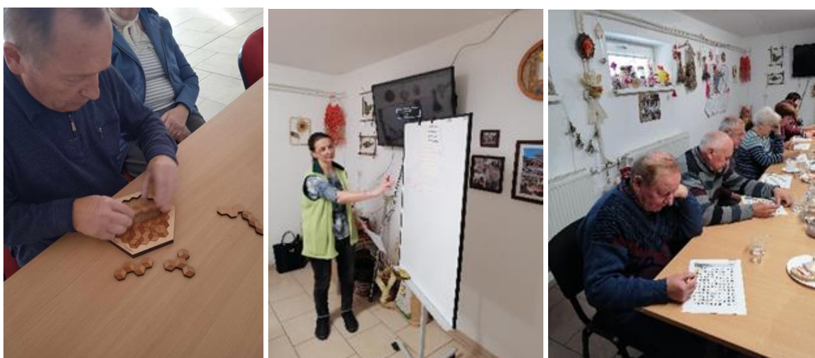
Denný stacionár ANIMUS Šarišské Sokolovce a Lutina „Tréning pamäte“

Počas roka sa prijímatelia venujú okrem tradičných ručných prác, sociálnej rehabilitácie aj tréningom pamäti, ktoré majú za úlohu posilňovať schopnosti prijímateľa a tým aj zdravé sebavedomie, ktoré prispieva k udržiavaniu ich sebestačnosti. Tréning pamäti prebieha prostredníctvom rôznych koncentračných cvičení, cvičení pozornosti, psychomotorických cvičení a podobne.