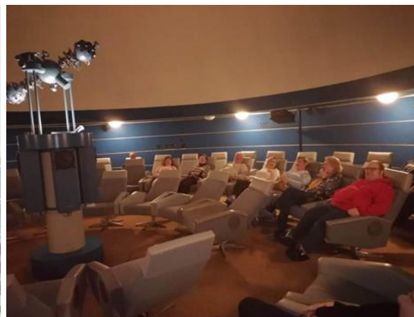
Denný stacionár ANIMUS Šarišské Sokolovce a Lutina „Hvezdáreň a planetárium v Prešove“