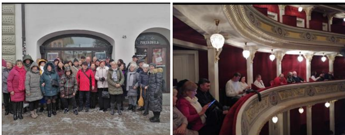
Denný stacionár ANIMUS Šarišské Sokolovce a Lutina „Divadelné predstavenie Sluha dvoch pánov“

Poslednou kultúrno-spoločenskou bodkou v roku 2023 bola návšteva divadelného predstavenia – Sluha dvoch pánov v divadle Jonáša Záborského v Prešove.