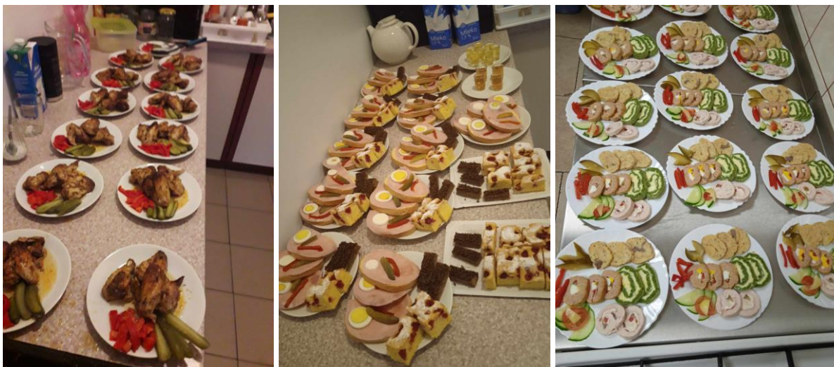
Denný stacionár ANIMUS Šarišské Sokolovce a Lutina „ Sociálna rehabilitácia – Kulinárske dni, svetová kuchyňa “

Počas leta sa snažíme čo najviac využiť pekné dni a vyplniť ich aktivitami mimo zariadení. Ďalším poznávacím výletom prijímatelia navštívili hneď niekoľko zaujímavých miest. Prvá zastávka viedla na výletnú loď Bohemia, ktorá kotvila na Domaši. Po vyhladkovej plavbe sa prijímatelia presunuli do Hanušoviec nad Topľou, kde ich čakala prezentácia Archeoparku. Poslednou zastávkou tohto dňa bola návšteva Ružencovej záhrady vo Vyšnej Šebastovej pri Prešove.