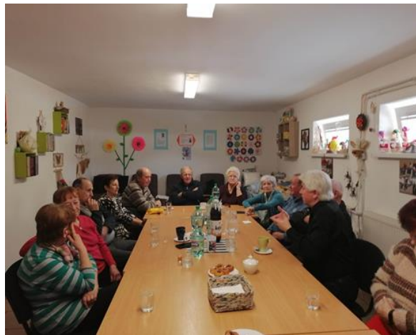
Denný stacionár ANIMUS Šarišské Sokolovce „Privítanie Nového roka 2023“