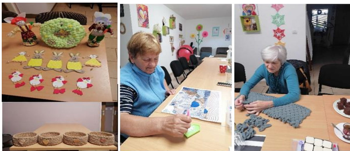
Denný stacionár ANIMUS Šarišské Sokolovce „Tradičné ručné práce – tvorivé dielne“