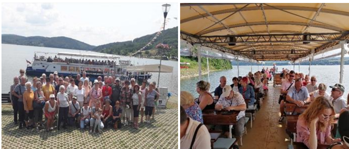
Denný stacionár ANIMUS Šarišské Sokolovce a Lutina „ Výletná plavba na Domaši “

Počas leta sa snažíme čo najviac využiť pekné dni a vyplniť ich aktivitami mimo zariadení. Ďalším poznávacím výletom prijímatelia navštívili hneď niekoľko zaujímavých miest. Prvá zastávka viedla na výletnú loď Bohemia, ktorá kotvila na Domaši. Po vyhladkovej plavbe sa prijímatelia presunuli do Hanušoviec nad Topľou, kde ich čakala prezentácia Archeoparku. Poslednou zastávkou tohto dňa bola návšteva Ružencovej záhrady vo Vyšnej Šebastovej pri Prešove.