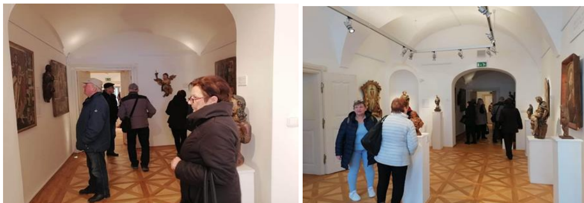
Denný stacionár ANIMUS Šarišské Sokolovce a Lutina „Šarišská galéria v Prešove“

Po návšteve hvezdárne prijímatelia v ten istý deň navštívili aj Šarišskú galériu v Prešove. Pre mnohých prijímateľov bola táto návšteva ich prvou návštevou tejto galérie.