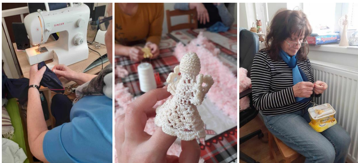
Denný stacionár ANIMUS Lutina „Tradičné ručné práce – tvorivé dielne“

Počas dní, ktoré neprajú aktivitám mimo zariadení sa prijímatelia venujú tradičným ručným prácam. Konečný výsledok tak dokáže skrásliť spoločný priestor, či potešiť niekoho blízkeho.