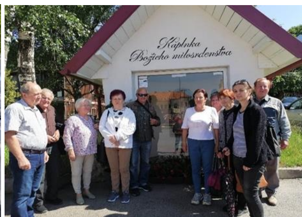
Denný stacionár ANIMUS Šarišské Sokolovce a Lutina „Sabinovský jarmok“

Vzhľadom na to, že záujem o kadernícke služby, manikúru, pedikúru a masáže pretrvával, tak sme sa rozhodli tieto služby našim prijímateľom zabezpečiť pravidelne aj v roku 2023 v našich prevádzkach. V prípade záujmu sa daná služba realizovala priamo v salónoch podľa požiadaviek prijímateľov.