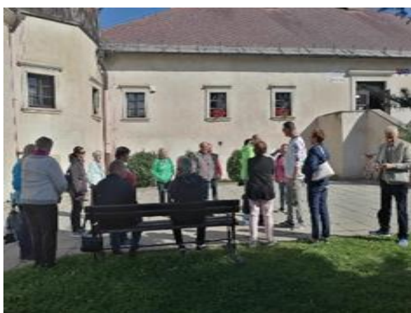
Denný stacionár ANIMUS Šarišské Sokolovce a Lutina „Návšteva obce Šarišské Michaľany“