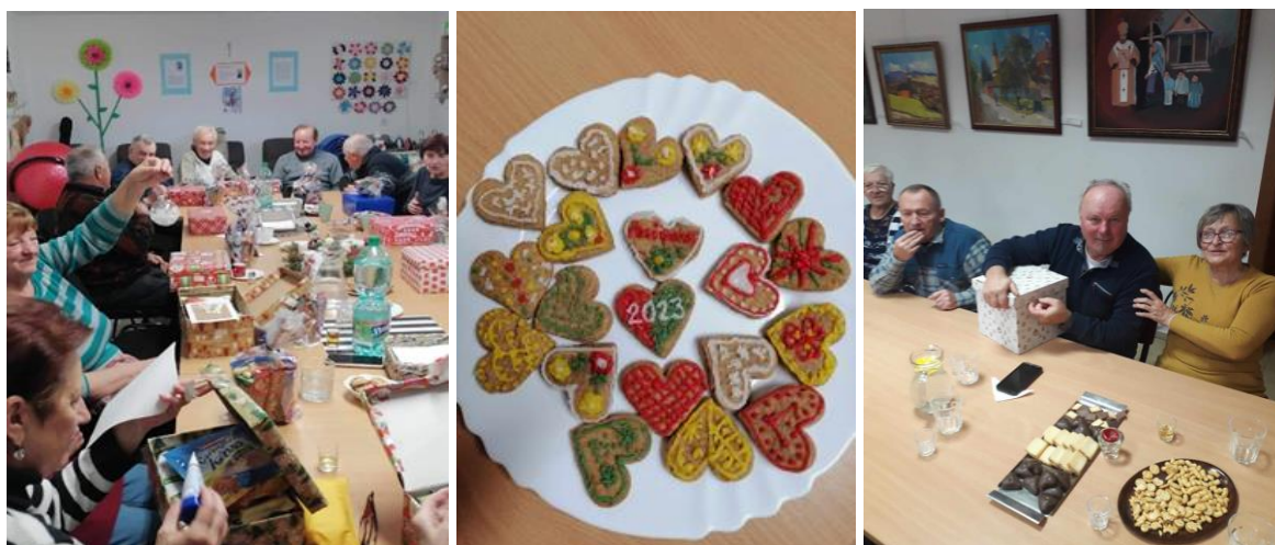
Denný stacionár ANIMUS Šarišské Sokolovce a Lutina „Vianočné posedenie“

Záver roka a predvianočný čas tradične patrí spoločnému posedeniu pri kapustnici. Vianočná výzdoba, príprava medovníkov a kapustnice už neodmysliteľne patrí k tradíciám našich prijímateľov. V tomto roku sme sa znova zapojili do charitatívnej akcie „Koľko lásky sa zmestí do krabice od topánok“ a balíčky, ktoré putovali seniorom im spravili veľkú radosť.