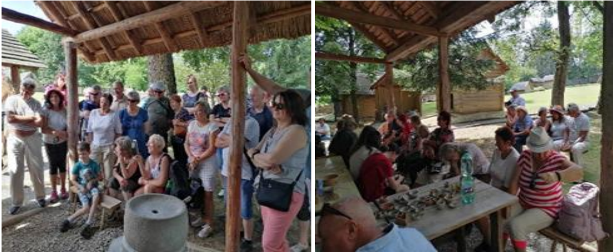
Denný stacionár ANIMUS Šarišské Sokolovce a Lutina „Hanušovce nad Topľou – Archeopark“

Snažíme sa v priebehu roka našich prijímateľov edukovať aj v oblastiach, ktoré sú aktuálne pre túto cieľovú skupinu. Po úspešnej prezentácii zdravotníckych tém a praktických cvičení KPR (kardiopulmonálna resuscitácia) sme tento rok pozvali príslušníka Policajného zboru, aby prijímateľom priblížil nástrahy, ktoré najviac ohrozujú seniorov.