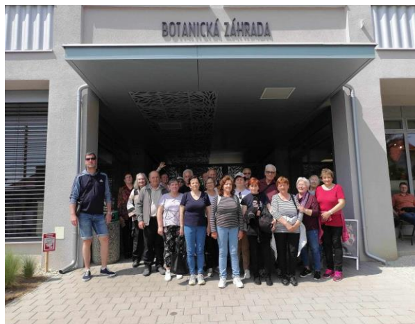
Denný stacionár ANIMUS Šarišské Sokolovce a Lutina „Botanická záhrada v Košiciach“

Sabinovský jarmok má už svoju dlhoročnú históriu a stáva sa už aj tradíciou našich prijímateľov, že účasť na tomto podujatí patrí medzi ich obľúbené.