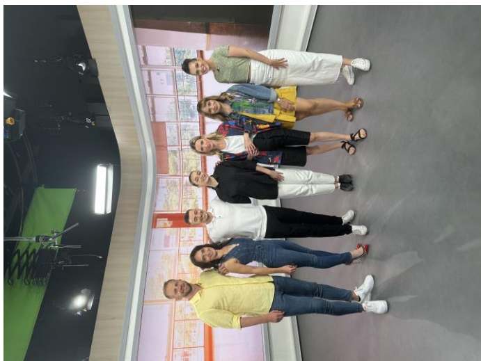
- druhé vysielanie Telerána na konci septembra