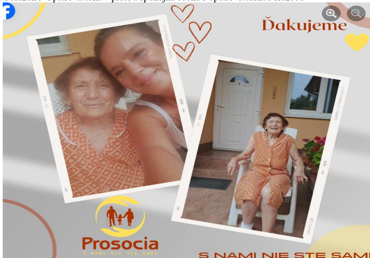
Obrázok 9 Opatrovateľka v práci a spokojná babka s opatrovateľskou službou

V roku 2023, sme k 31.12.2023 zabezpečili opatrovateľskú službu celkovo pre 28 prijímateľov sociálnej služby (iba v Nitrianskom kraji). Počet opatrovateľiek a opatrovateľov, ktorí sa starali o prijímateľov sociálnej služby v domácom prostredí bolo k 31.12.2023 celkom 29.