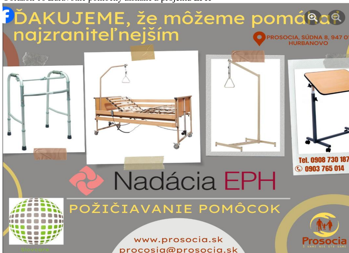
Obrázok 10 Zdravotné pomôcky získané z projektu EPH

operácii, dočasná imobilita alebo rehabilitácia. Namiesto investovania do drahého vybavenia, ktoré bude potrebné len na krátky čas, môžu jednotlivci využiť možnosť požičiavania. Požičiavanie pomôcok prispieva k zníženiu odpadu a podporuje udržateľnosť. Opätovné používanie zdravotníckych pomôcok a zariadení znižuje potrebu výroby nových produktov, čo má pozitívny dopad na životné prostredie. Tento prístup podporuje recykláciu a efektívne využívanie zdrojov. Požičiavanie pomôcok umožňuje jednotlivcom vyskúšať si rôzne zariadenia pred tým, než sa rozhodnú pre ich kúpu. Tento prístup je užitočný, pretože pomôcky môžu byť drahé a nie vždy je jasné, ktoré zariadenie bude najlepšie vyhovovať konkrétnym potrebám. Skúšanie pred kúpou minimalizuje riziko zbytočných investícií. Požičiavanie pomôcok ponúka množstvo výhod, vrátane finančnej úspory, dostupnosti kvalitného vybavenia, flexibility, ekologického prínosu a podpory neziskových organizácií. Tento prístup umožňuje jednotlivcom a rodinám efektívne zvládať zdravotné a rehabilitačné potreby bez nutnosti vysokých finančných investícií.