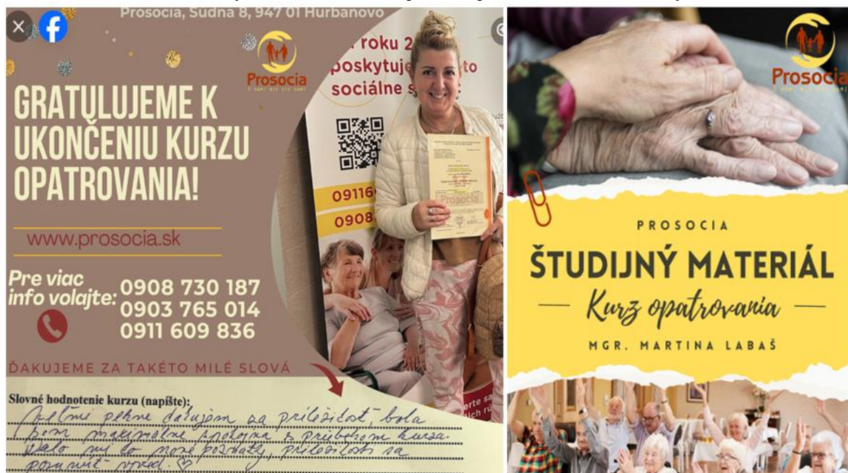
Obrázok 7 Vzdelávanie opatrovateliek a nový učebný materiál ku Kurzu opatrovania

V roku 2023 sa do kurzov opatrovania prihlásilo 112 frekventantov. Úspešne ukončilo kurz opatrovania 110 absolventov kurzu opatrovania. Kurzy prebiehali v Novej Bani, Žiline a Šahách. Počet študentov kurzu opatrovania sa zvýšil oproti roku 2022 z dôvodu stabilizovania pandemickej situácie a COVID-19 už nebol takou prekážkou pre osobnú účasť na kurzoch opatrovania, čo umožnilo opäť viacerým ľuďom sa zapojiť do vzdelávacieho programu. Opatrovateľstvo má významný pozitívny dopad na spoločnosť. Kvalifikovaní opatrovatelia poskytujú dôležitú podporu zraniteľným skupinám obyvateľstva, čo prispieva k celkovej kvalite života a zdravia v komunite. Tým, že sa niekto rozhodne absolvovať kurz opatrovania, prispieva k riešeniu jedného z kľúčových sociálnych problémov dnešnej doby – starostlivosti o starúcu populáciu.