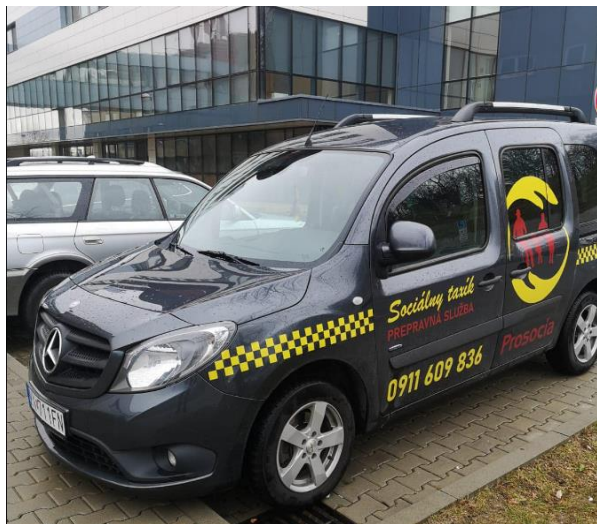
Obrázok 13 Prepravná služba

so sídlom: A. Fesztyho 23, 947 01 Hurbanovo IČO: 42049229, DIČ: 2023122035