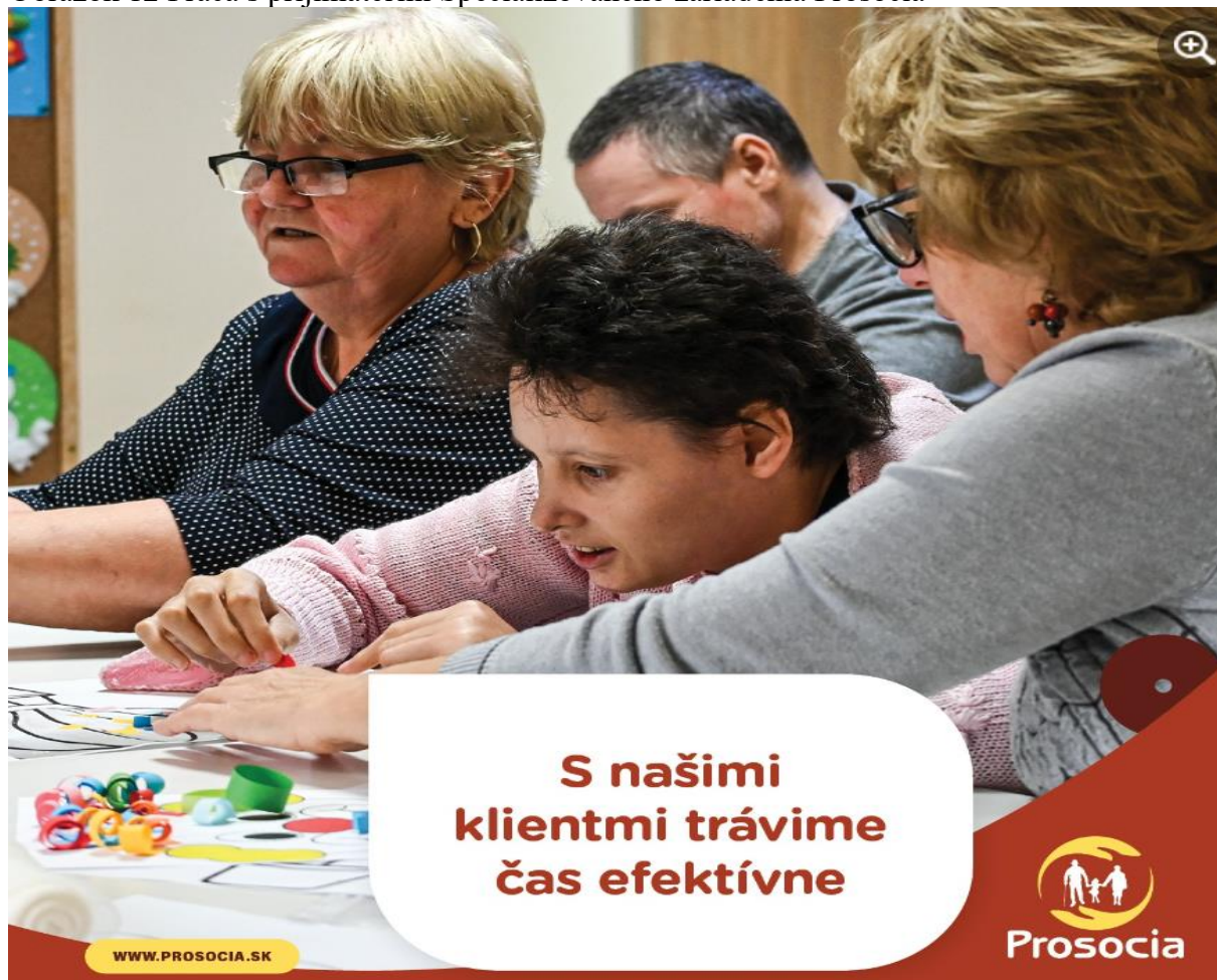
Obrázok 12 Práca s prijímateľmi Špecializovaného zariadenia Prosocia

so sídlom: A. Fesztyho 23, 947 01 Hurbanovo IČO: 42049229, DIČ: 2023122035