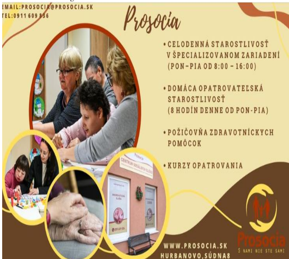
Obrázok 1 Činnosť organizácie Prosocia v skratke