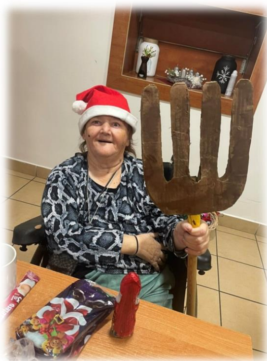
Mikulášsky beh, Kráľovský Chlmec