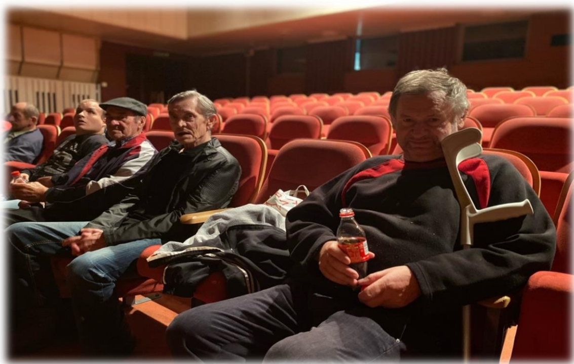
Návšteva kina Michalovce