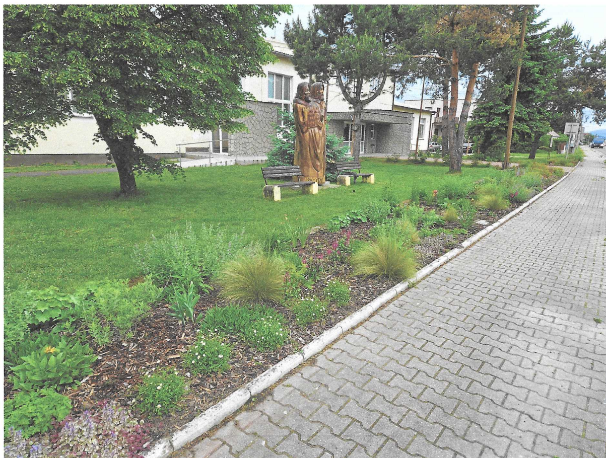
Priestor pred KD, výsadba trvalkového záhona.

Medzi významné finančné akcie, ktoré sme uskutočnili v uplynulom roku boli nepochybne investície do vybudovania kanalizačných prípojok budov vo vlastníctve obce. Postupne sme pripojili budovu základnej školy s materskou školou, bytové domy súpisné číslo 145, č.519, č.520, Kultúrny dom a kabíny TJ a Šport klub. Keďže sa nachádzajú pod zemským povrchom, nikto ich nevidí, ale pre nás majú obrovský finančný, úsporný, praktický, účelný, ale najmä ekologický význam.