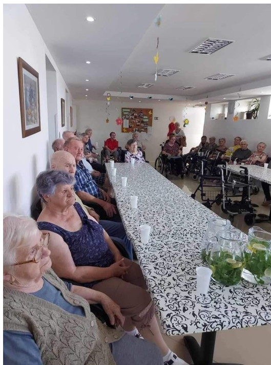
Aktivita – voľný čas