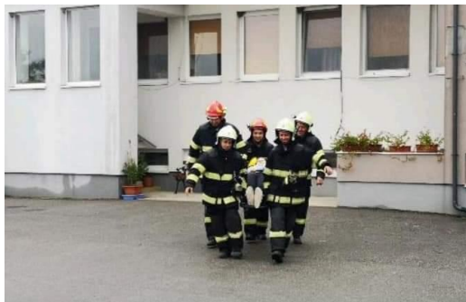
Zo života prijímateľov - Galéria