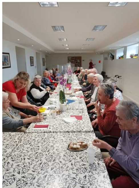
Príprava na 1.máj