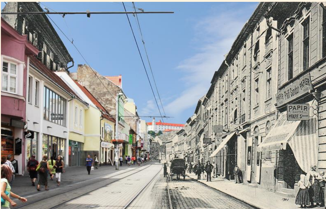
*Obchodná uica v premenách času.

Históriu mesta tvoríme my všetci, každou minútou sa odohrané príbehy stávajú jej súčasťou. ĎAKUJEME