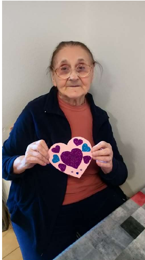
Prípravy k Veľkej noci v našom zariadení