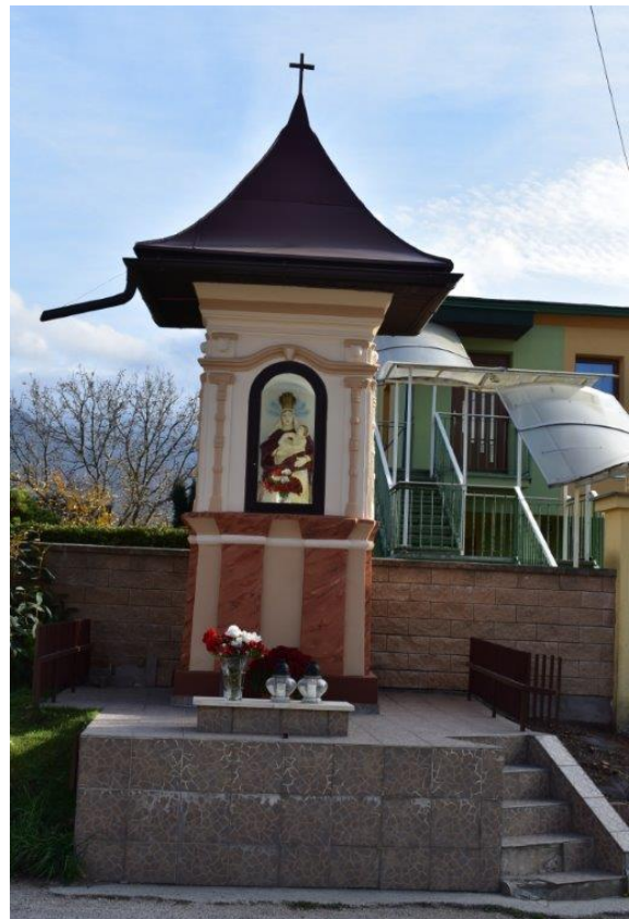
Obnovená kaplnka v roku 2018

V obci je tiež renesančný kaštieľ s menším kostolíkom, ktorý bol od druhej polovice 16. storočia sídlom staro-hradského panstva. Okolie dotvára park. Kaštieľ je toho času v súkromnom vlastníctve. Vlastníkom je spoločnosť G.R.L. s.r.o. Žilina.