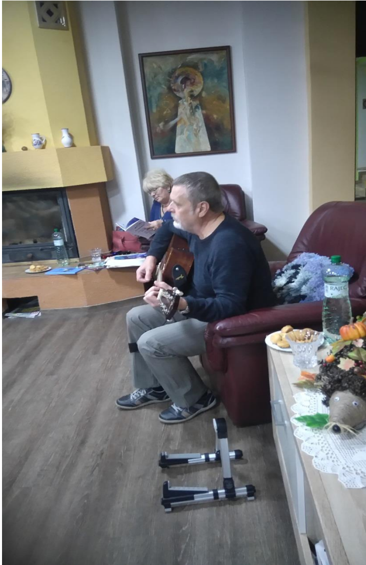
❖ „Mikuláš na Vitalite