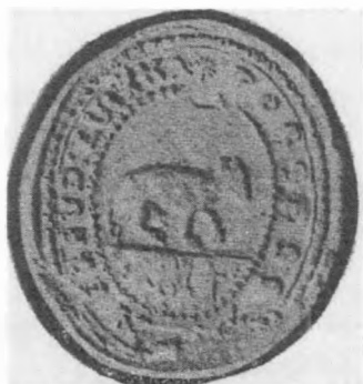
(pečať obce z roku 1814)

Návrh erbu bol ideovým námetom, vytvoreným na základe rozboru najstaršieho známeho heraldického prameňa - spomínanej obecnej pečate. Pri vlastnom výtvarnom spracovávaní bolo pritom potrebné v čo najvyššej miere zohľadniť tvar a podobu pôvodného znamenia z tejto pečate. Vzhľadom na jej vek nevedeli presne určiť, či je na nej zobrazený medveď alebo ovca, čo viedlo k pochybnostiam, ale zo Štátneho archívu v Bytči bolo nakoniec potvrdené, že je to medveď.