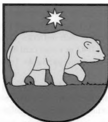
(erb obce Nezbudská Lúčka)

Takáto podoba erbu obce Nezbudská Lúčka bola prijatá do platnosti na základe odsúhlasenia obecného zastupiteľstva 5. mája 2005. Na tomto zasadnutí bol prijatý a teda aj schválený ďalší symbol obce, ktorým je obecná vlajka. Tá pozostáva zo štyroch pozdĺžnych pruhov vo farbách bielej (1/9), modrej (2/9), žltej (3/9) a zelenej (3/9). Vlajka má pomer strán 2:3 a ukončená je tromi cípmi, t.j. dvomi zástrihmi siahajúcimi do tretiny jej listu. Symboly obce Nezbudská Lúčka sú zapísané v Heraldickom registri Slovenskej republiky pod signatúrou N-.112/2005.