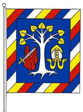
Štandarda starostu obce