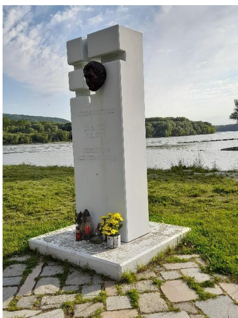
Pomník AS v Devíne