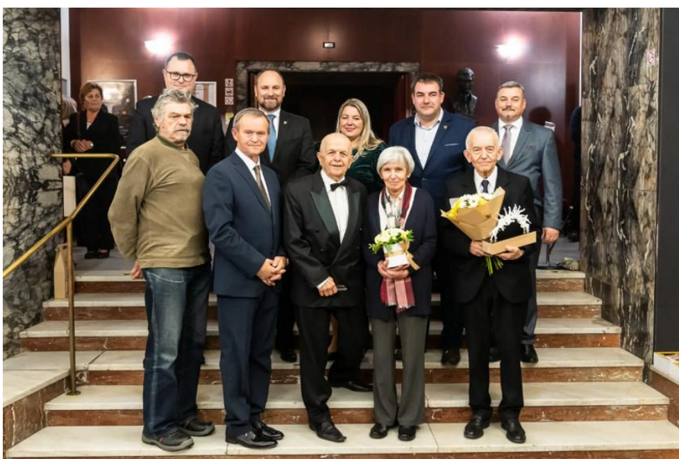
Lauráti Ceny slobody Antona Srhoľca 2023