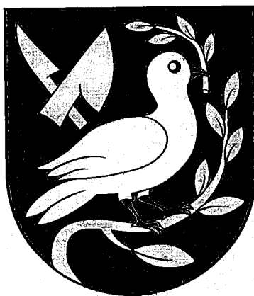
Erb obce Chropov

V zmysle heraldickej konvencie bude možné zlatú podľa potreby zamieňať aj žltou a striebornú bielou, pričom sa však bude vždy popisovať ako zlatá a strieborná.