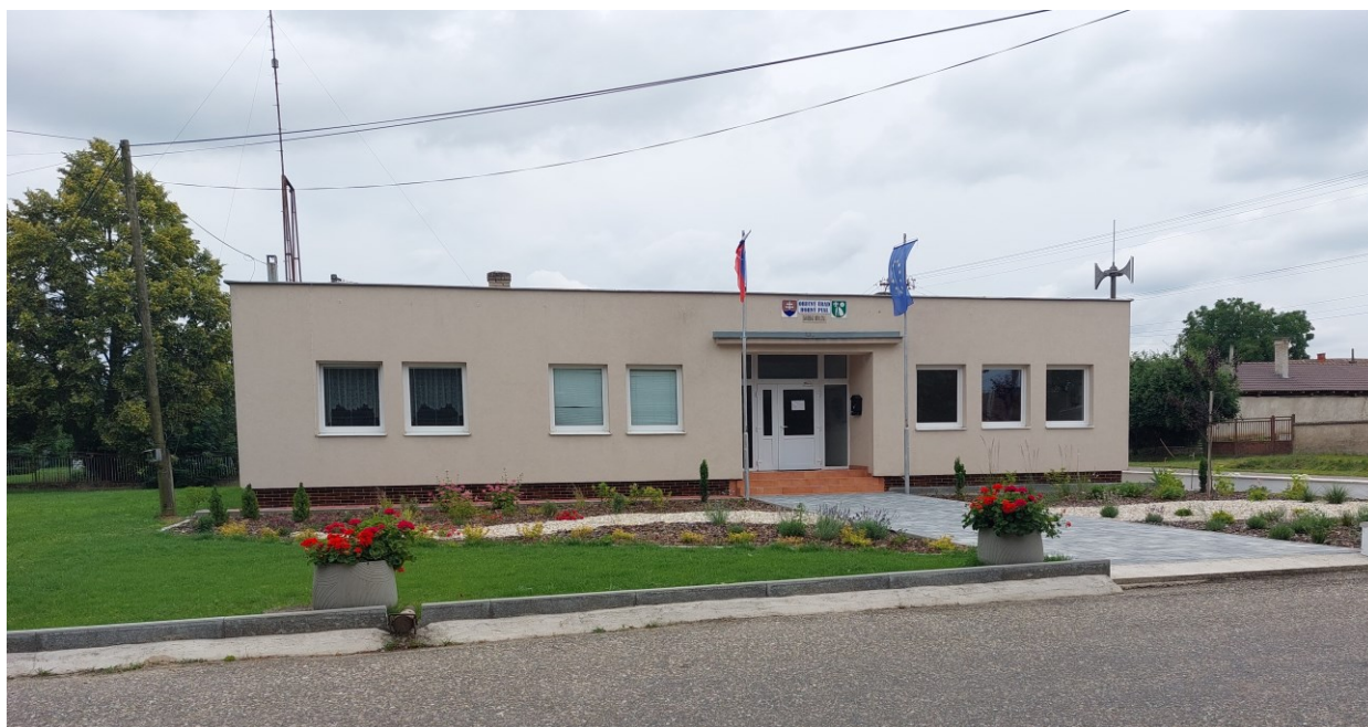
Budova Obecného úradu