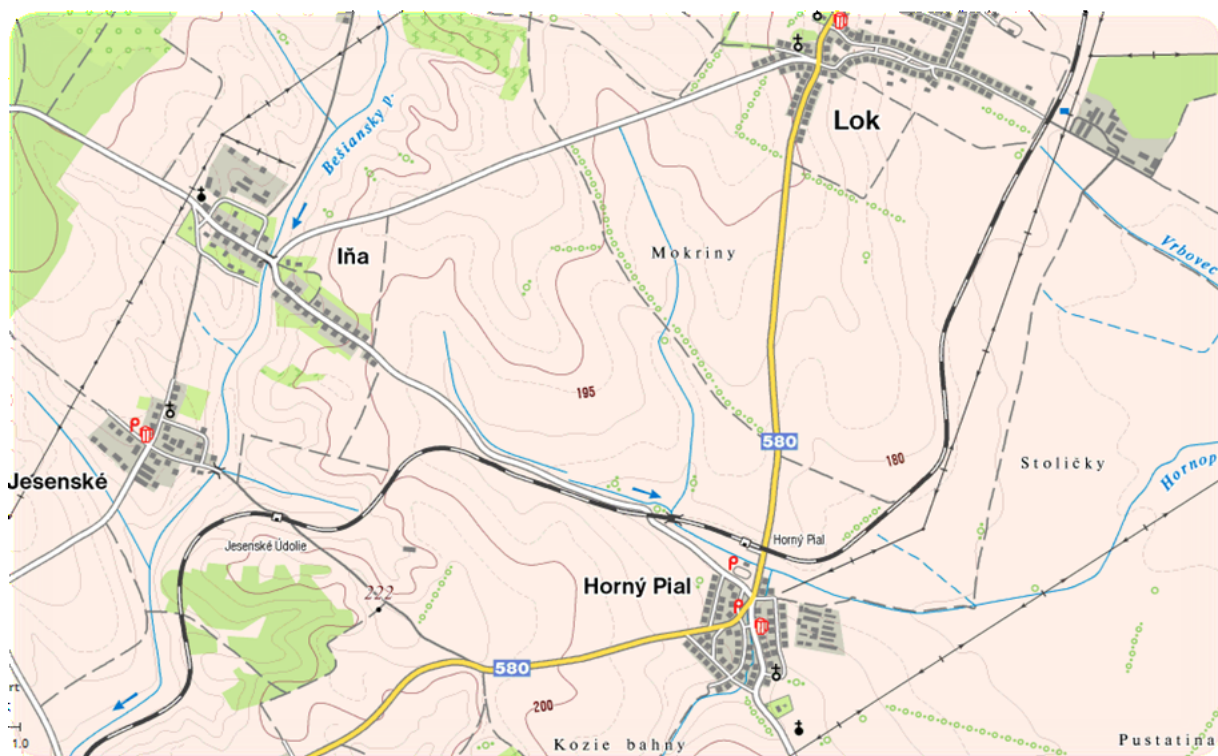
Lokalizácia obce v rámci okresu