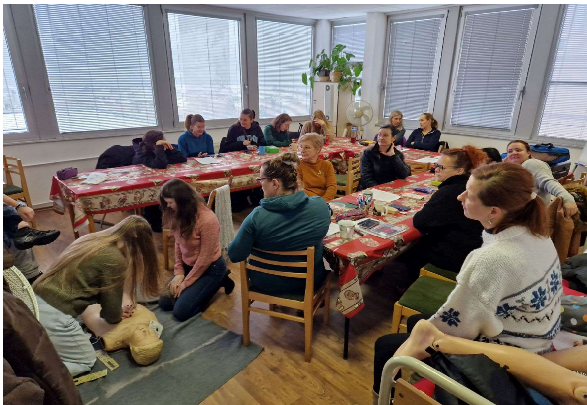
33 hodinový kurz PRVEJ POMOCI