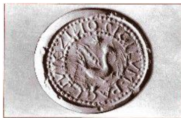
Staršie pečate - občasť z roku 1752