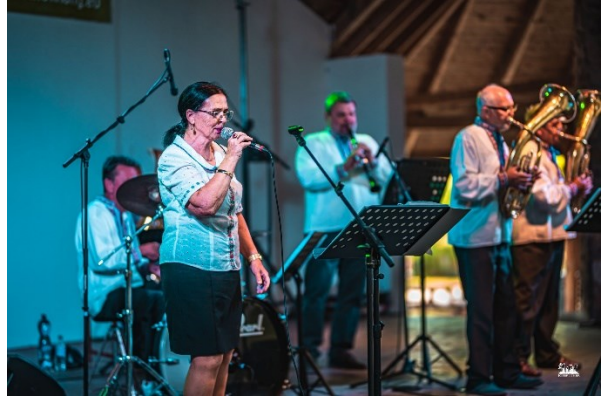
01.07.2023 - Obecné dni (sobota)