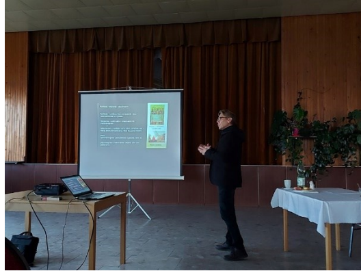
03.12.2023 - Oslava mladého vína