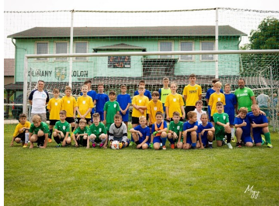
01.07.2023 - Obecné dni - LIVER SING