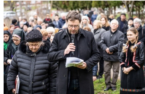
07.04.2024 - Veľkonočné tvorivé dielne