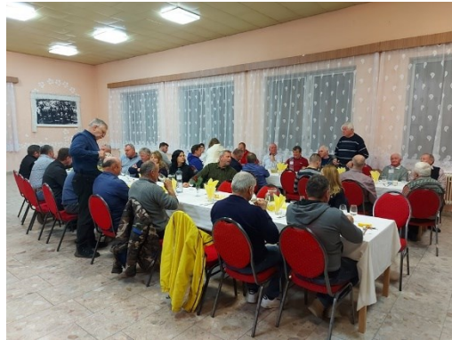
05.12.2023 - Mikuláš v obci