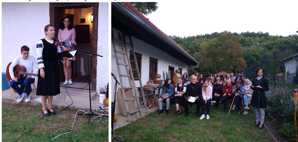
16.10.2023 - Literárna kaviareň