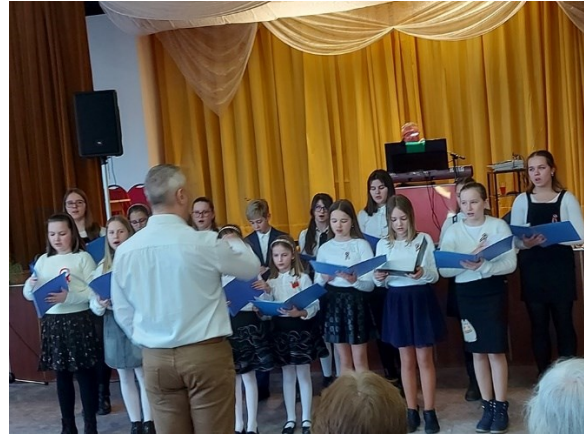
25.03.2023 - Krížová cesta