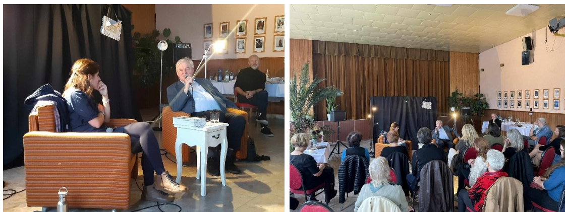
29.10.2023 - Večer spoločenských hier