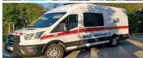
30.09.2023 - Indiánske leto