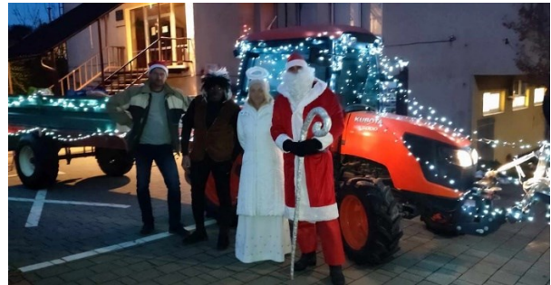
16.12.2023 - Vianočný koncert