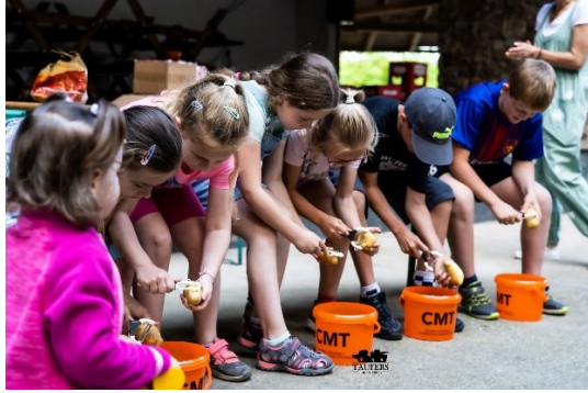
30.06.2023 - Obecné dni (piatok)