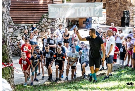
02.09.2023 - 17.Kastrol a koláčfest