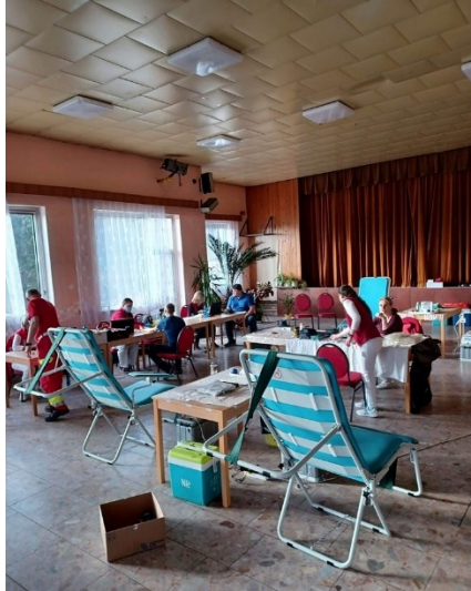
19.03.2023 - Kultúrne podujatie