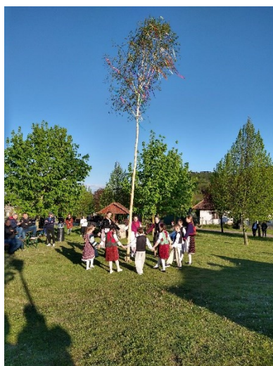
07.05.2023 - Deň matiek