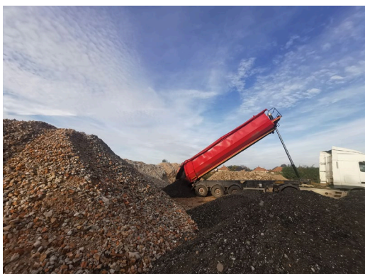
c)drvenie betónu na zbernom dvore