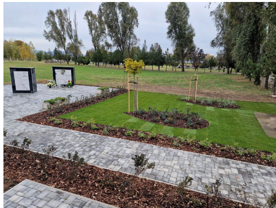
b) realizácia parku pri urnovom háji