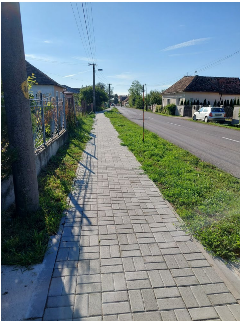
e) časť vybud. chodníka na ul. Mlynskej