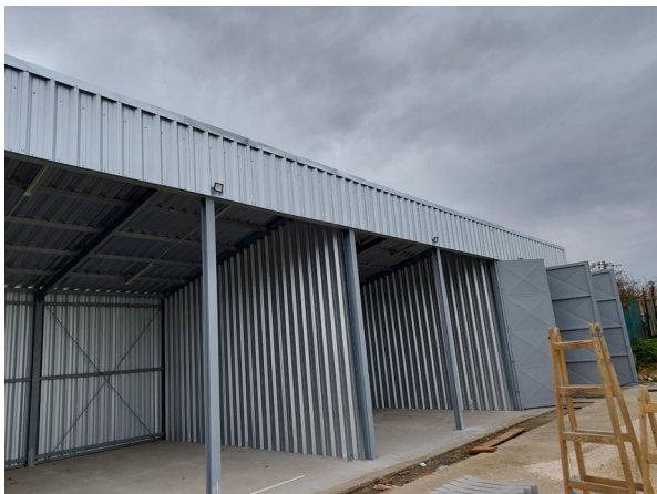
g) zberný dvor - stavba z projektu