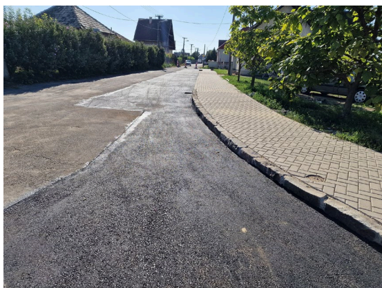
a) asfaltovanie na ulici Lúčky