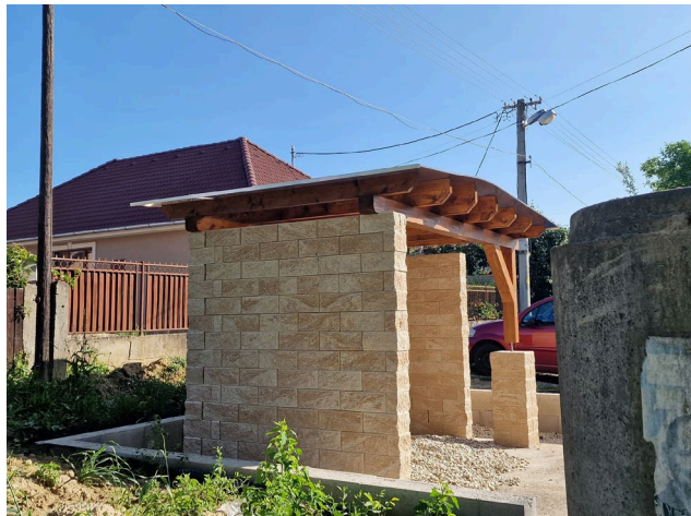
f) nové autobusové zastávky v obci