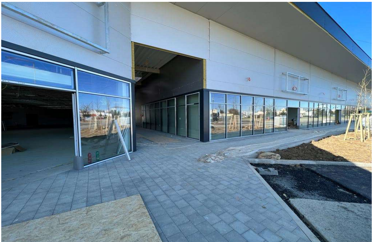
Obchodné centrum Košice