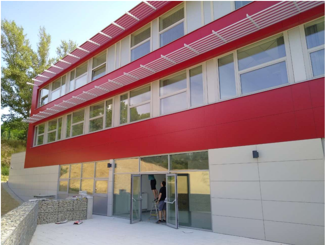
Univerzita Komenského Bratislava