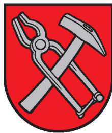
Erb mesta Revúca