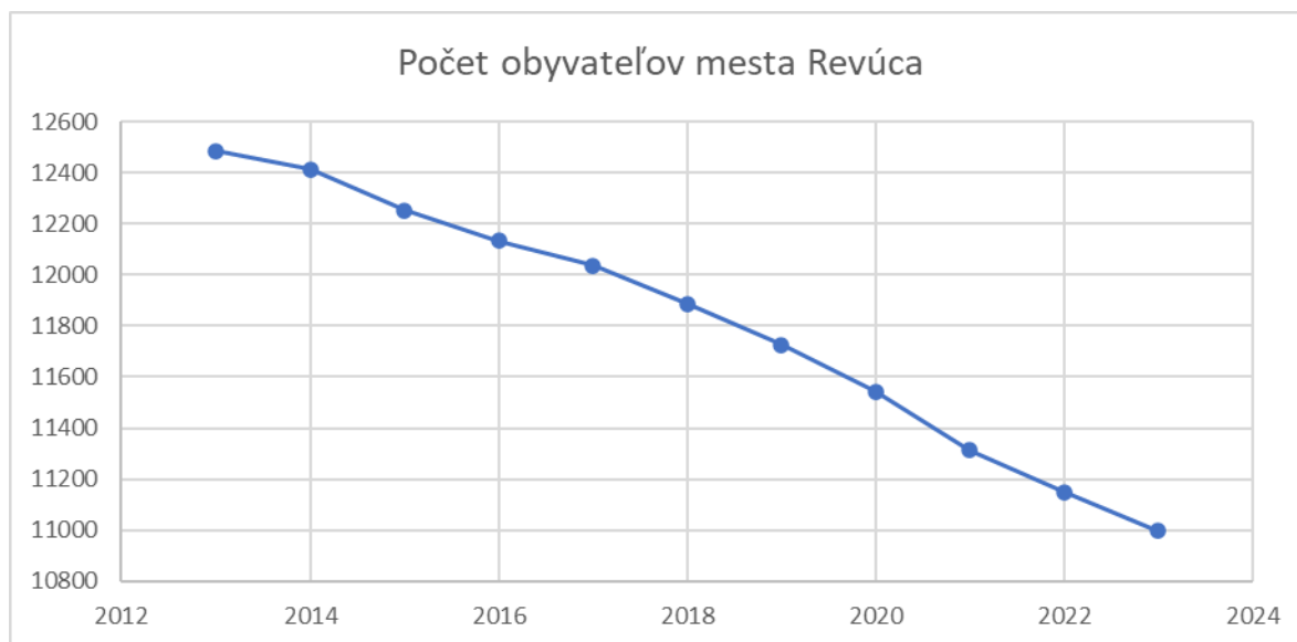
Tabuľka 1 – Vývoj počtu obyvateľov mesta Revúca v rokoch 2012 – 2023