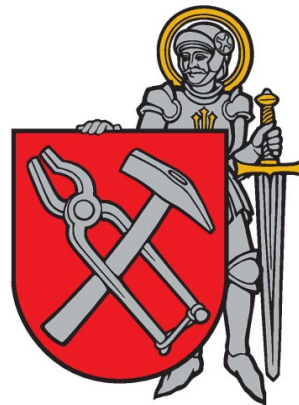
Erb mesta Revúca s nositeľom