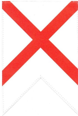
Vlajka mesta Revúca