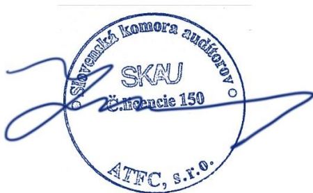
ATFC, s.r.o., Bratislava Licencia SKAu č. 150