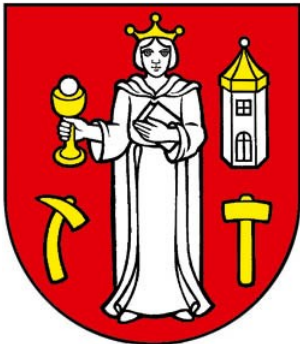
Erb mesta Krompachy