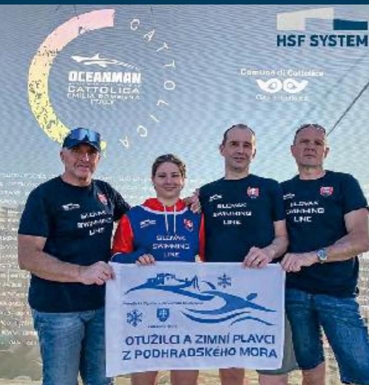
SLOVAK SWIMMING LINE