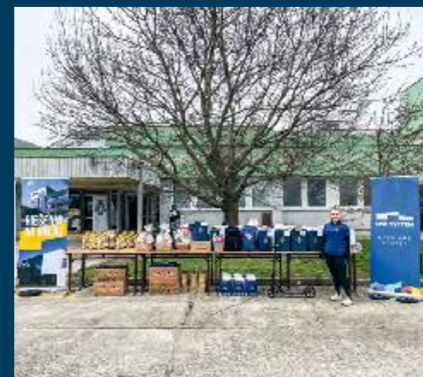
ŠPORTOVÝ DEŇ POLICAJNÉHO ZBORU BA