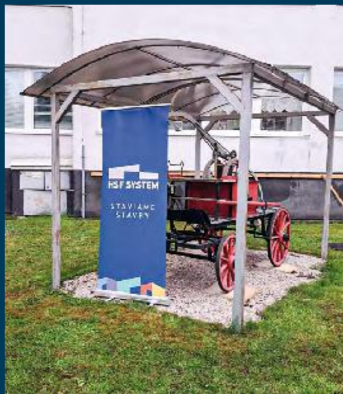
DEŇ DETÍ STREDNÁ ŠKOLA POŽIARNEJ OCHRANY MV SR