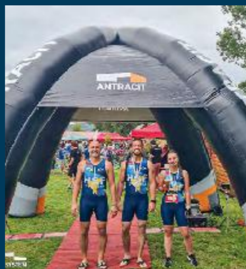
TRITLON PODHRADSKÉ MORE