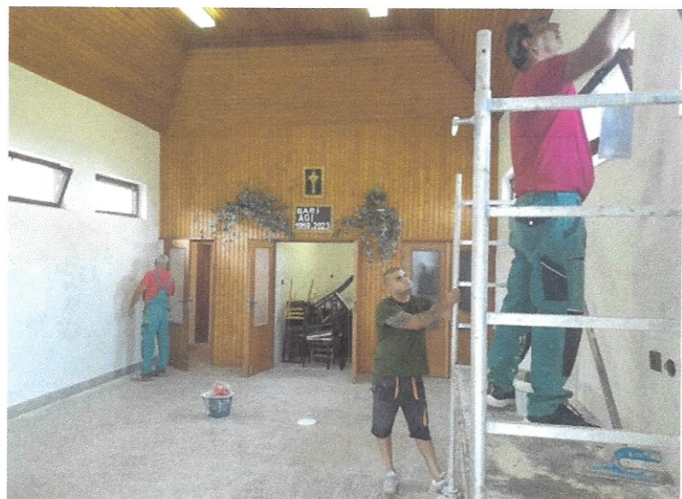
Foto: Tím Obnovme Gemer, n.o. pri vonkajšej i vnútornej obnove objektu domu smútku v obci Chrámec.