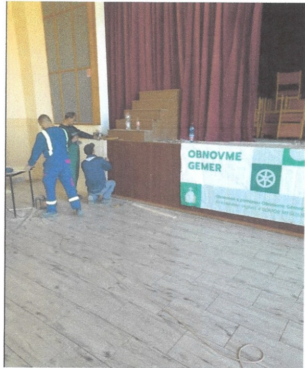
Foto: Tím Obnovme Gemer, n.o. pri tréningu kladenia interiérovej dlažby v objekte kultúrneho domu v obci Gemer.

V roku 2023 sme sa venovali aj profesionalizácii zručností našich pracovníkov. Realizovali sme viaceré workshopy a kurzy, ktoré nás vedú k zlepšovaniu odborných vedomostí i praktických skúseností a celkového majstrovstva profesie. V spolupráci s partnerom Gotická cesta, o.z. sme participovali na workshope v Henckovciach, kde sa naši pracovníci pod vedením skúseného kamenára oboznamovali s kamenárskymi technikami.