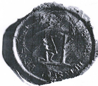
Pečať z 19. storočia

Na pečati s kruhopolisom PORUBKA HELYSÉGE PETSÉTYE (Pečať obce Porúbka) je vyobrazený na pôde strom a vedľa neho kľáčiaca mužská postava v klobúku, v oboch rukách držiaca sekeru.