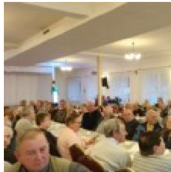
Mesiac úcty k starším

V obci sú zriadené tri folklórne súbory : DFS –Dubovičanček, MSS-Dubovičan, ŽSS-Dubovičanka a občianske združenie Dubovičan, ktorému obec poskytuje dotácie na základe VZN a Dohody o poskytnutí dotácie.