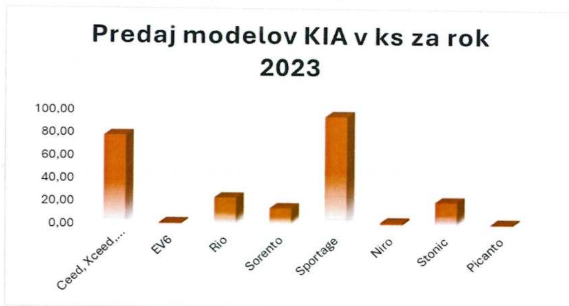
Graf 2: Porovnanie predajov jednotlivých modelov značky KIA

Spoločnosť analyzovala rizikové faktory. V oblasti technológií je problém hlavne so zabezpečením kvalifikovaných pracovníkov hlavne na pozície servisu motorových vozidiel, špeciálne pozíciu autolakýrnik. Spoločnosť sa to snaží riešiť aj primeraným finančným zabezpečením zamestnancov, aby nedošlo k úbytku vyškolených zdrojov. Tento problém by bolo možné riešiť aj vďaka zmenám v duálnom systéme vzdelávania a tak si pomôcť vychovať pracovníkov na jednotlivé pozície ale efekt by sa prejavil až v dlhšom časovom horizonte.